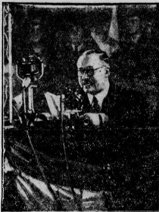
Darányi Kálmán miniszterelnök beszél

ékszerész Budapest, IV. Kecskeméti-utca 9