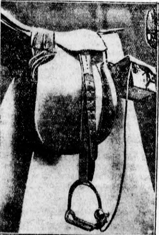
Villanylámpa a kengyelen.

Hogyan gazdálkodjunk? A gazdának fáraósos munkáján kívül meg kell küz- denie a gazdasági élet nehézségeivel is. A mai nehéz viszonyok súlyos feladatok megoldása elő állítják az östernelők és állattenyésztők társadalmát. Magyaror- szág agrárállam lévén, a mezőgazdasági termelésnek kell a jövőrelem legfőbb té- nyezőjeként szerepelnie. Mindamellett a gazdának gondolnia kell a jövőre is. Csekély kockázattal megkísérrelhet szereposóját, ha a Török A. és Tárán Bank- házában (Budapest, IV., Szeréna-tér 3.), a nemokára kezdődő m. kir. osztályosor- játékra sorsjegyet vesz. Elérhető legna- gyobb nyerevény: hétézszer pengő. Sorsjegyárak: Egész 28, fél 14, negyed 7 pengő. Minden második sorsjegyet nyer.