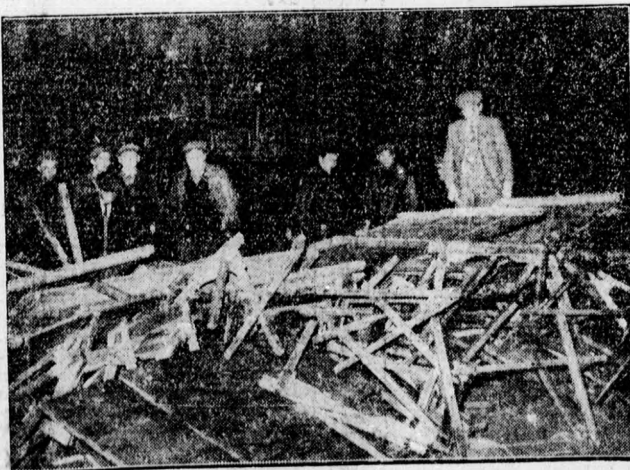
A francia kommunisták egy napra csatateret csináltak a párisi utcákban A barikádharok alkalmával négy ember meghalt, négyszáz megsebesült