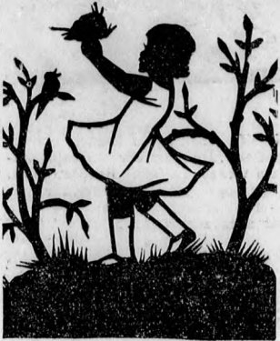
Itt a tavasz!