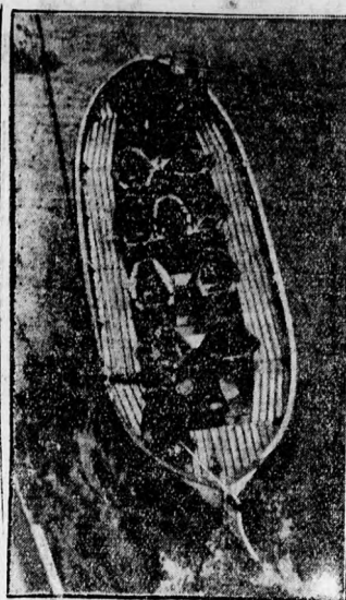
Mentőcsónak — evező nélkül Hasonló a motorcsónakhoz, de viharok tengeren is használható

A kiállítás tenyészállatvásári for- galma Kereken 1.317.000 pengő volt, a multévi 730.000 pengőöz képest. Gazdát cserélt 65 mlt 2190 P átlagáron, 7 kancá 995 P átlagá- ron, 600 bika 1271 P átlagáron,