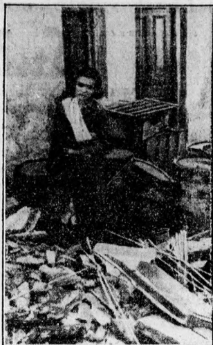
Kép az ostromlott város Madridból

— Örömmel akarok kifejezést adni, — mondotta — hogy mind- azoknak arcát viszontláthatom, akik annak idején elsősk voltak a rend szol- gálatában, önzetlenül, hazafiaságból. Meg vagyok győződve, hogy ha uj- ra szükség lesz rátok, ti valameny- nyien épp oly önzetlenséggel, épp oly elszántsággal fogtok helytállani. Az a kérésom, hogy szolgálja mindenki hűséggel a hazát azon a helyen, ahová őt a sors állította.