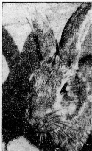
A husvét egyik gyermekátma.