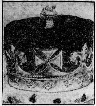
Az angol trónörökösön koronája