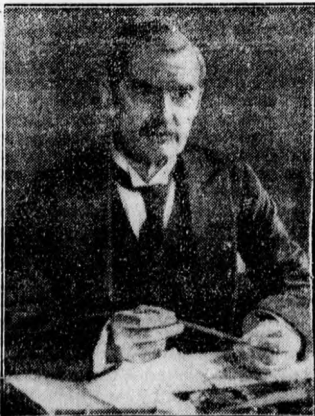
Neville Chamberlain, az új angol miniszterelnök

A m. kir. Főudvarnagyi Biroság június 2-án tartott tárgyalásán felbontotta az Albrecht királyi herceg és Lebach Iré n, Rudnay Lajos volt szófiai magyar követ elvált felesége között 1930-ban kötött házasságot. A királyi herceg volt felesége a jövőben a „ tescheni hercegné ” címet viselheti.