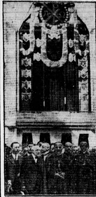
Pacelli bíboros Párisban a világiállítás vatián-pavillonja előtt.

Gyilkos az amerikai hóhüllőm. Az amerikai hóhüllőm halálát okozóinak száma napról-napra emelkedik. Eddig közül felezen pusztultak el a hőség miatt. A hőmérséklet már meghaladja a negyven fokot, az uszodák, folyók víze is annyira felmelegszik, hogy jégdombok- ket dobálnak a vízbe, hogy kissé lehűl- tsek a vizet. Az amerikai természet a tar- tóes azály teljes pusztulásra fenyegeti.