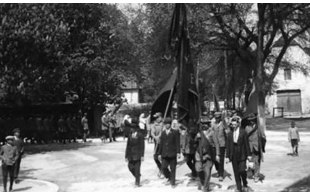
Köztársasági Véderő, az osztrák munkásörsg demonstrationja 1925-ben Kismartonban