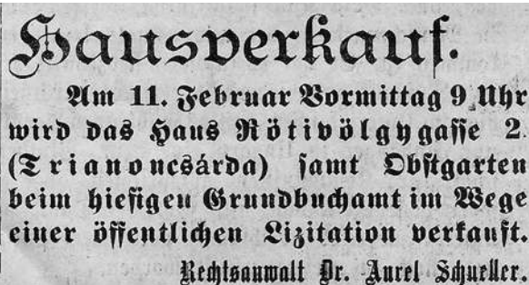
A trianoni csárda eladásának német nyelvű hirdetése (Günser Zeitung, 1932. febr. 13. 4. p.)