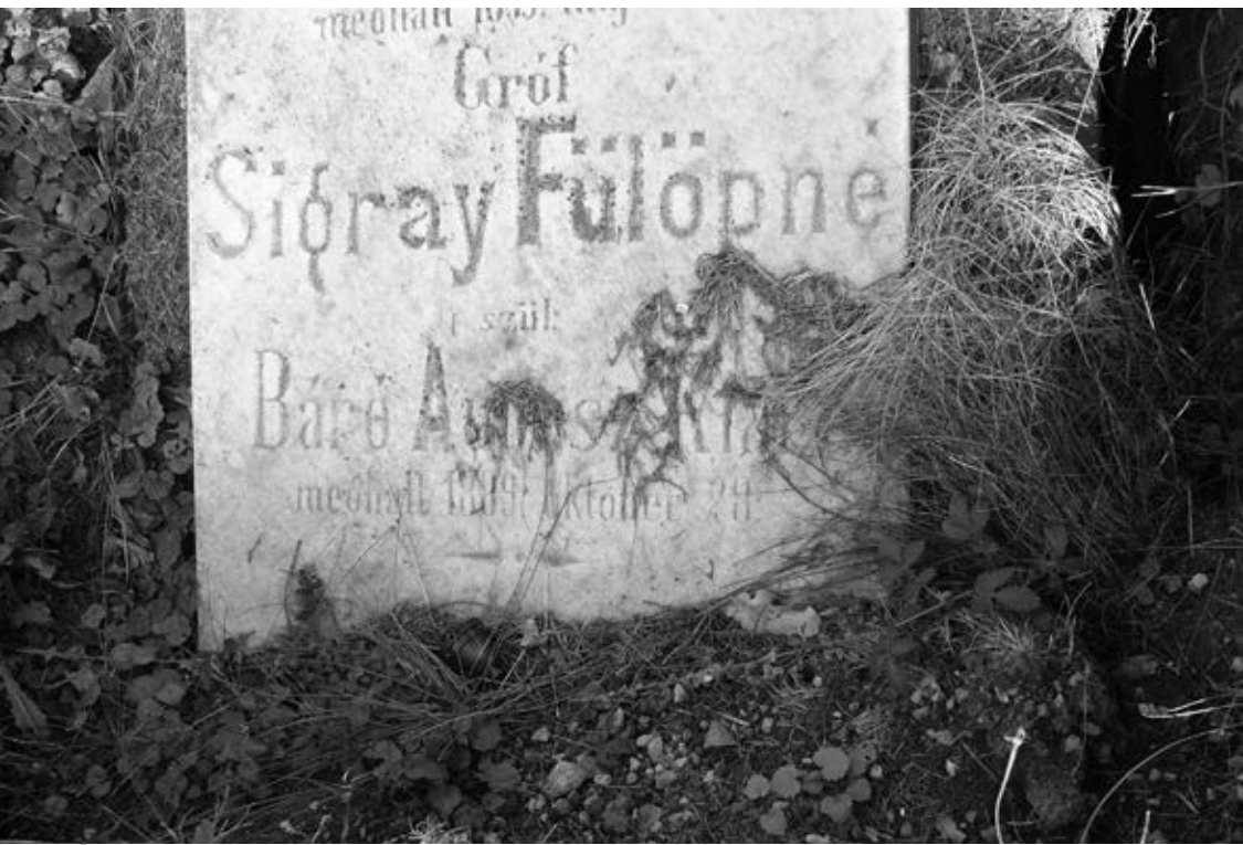
Gróf Sigray Fülöpné Augusz Klára sírköve az ivánci családi sírkertben