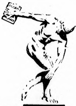
Diszkoszvető: — Most jön a rikord: Az olcsó Wallace!