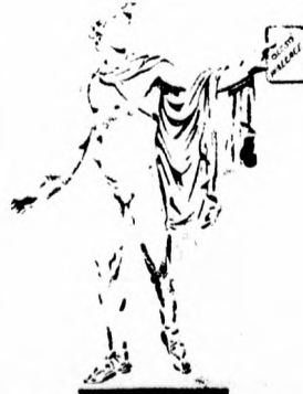
Belvederet Apolló: — Mi ketten győztünk: én a szépségemmel, „Dante” az olcsó Wallace-szal.