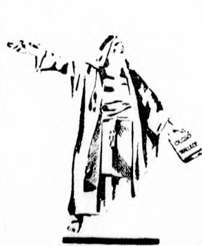
Munkácsy: Főpap: — Vádolom Wallace-t, mert izgat és vakmerően olcsó.