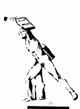
A Bajtűvő: — Hurrá! Az olcsó Wallace győzött!