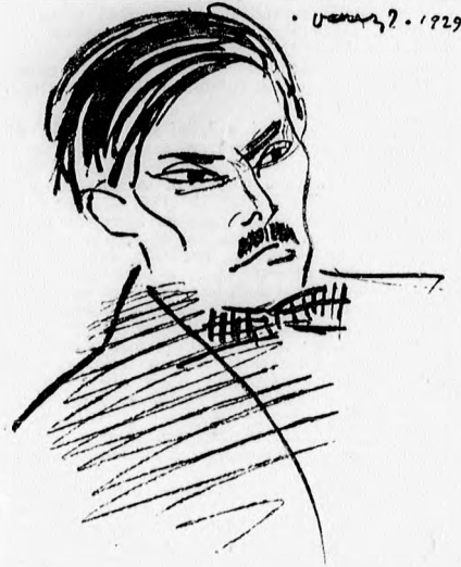
A Reggel számára rajzolta Vaszary János.

Hasonló valami ez a tükröző játéklőz! Az ő tüzes magyar temperamentumán, mint valami farsangi jelmez, kacérokodik a francia kultúra sokrétű cicomája, sallangja, mégis, ami művészet föléillog tükrében: palástolhatatlanul és végérvényesen magyar. Bár művészete a francia impresionizmus melegágyában érett: gyökerei kitéphetetlenül ide kötődtek, innen táptáplálják; könnyedségén átüt, akár csak idegenségbe szakalton, a forszírozott kiejtés, az önsúlyával birkózó darabos erő. Eleme s festői sajátossága a szín, amelynek formát, vonalat s mindent, ami köli szárnyalásában: aláhajt. Itt, a színek krátertüzeiben éli ki forró erotikáját, amelytől alkotásai