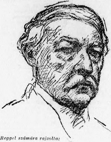
A Reggel számára rajzolta:

A feje: egy diplomatáé, vagy — egy alföldi juhászé. A nézése: mint a bársony. Simogat. Az arcát vörösrre csókolta a lellei naptüz, most még zuzmarásabb rajta a hófehér bajusz. (Míntha odaragasztotta volna.) A fejét is ez a frissen hullott zuzmára borítja, ezt lágyan féloldalra simítja. Szemeiben, mint egy fészeken, esőndösen szemlélődik a nyugalom. Ha beszél: szvai lombozatában somogyi szellők fujdogálnak.