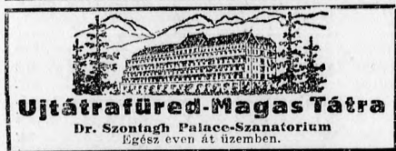
Ujtrafűred Magas Tátra Dr. Szontagh Palace-Szannatorium Egész éven át üzemben.

— Ugynevezett „Bajor-műsört” ad ezuttal az Andrassy-uti, prezentálván a Nemzeti nagy művésznőjét egy kis Zilahy-darabban. Leírha- taltan bájjal, ezernyi színnel, a mozdulatoknak s a játéknak egy olyan szívdörvényos sugárzá- sával önti el ez a titokzatos szépségű és tehet- ségű legnagyobb művésznő nemesak az igény-