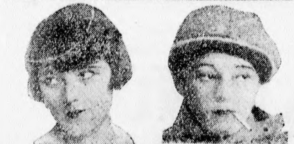
BAJOR GIZI 4 utó só föllépése az Andrássy-úti Színház szenzációs műsorában

Fővárosi Művész-Színház (volt Operettszínház)