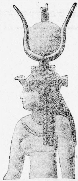
Szántó György új történelmi regénye:

(A Reggel tudósítójának telefonjelentése.) A Balatonfüredi Mezőgazdasági Bizottság vasárnapra a Járás szőlősgazdái gyűlésre hívta össze. A gyűlésen, amelyen a kerület országgyűlési képviselője, Héjji Imre is megjelent, az egész környék szőlősgazdái képviseltették