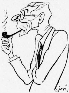
Gróf Károlyi Gyula

(A Reggel tudósítójától.) A mult számunkban megjelent ankét-sorozat a politikai mozgalmak középpontjába állította a nemzeti összefogás régen vajdudó kérdését. Miután Károlyi miniszterelnöknek a képviselőházban, majd az egységes pártban tett erre vonatkozó nyilatkozata és a kormánypárt egyrészenek főfőgása között ellentét mutatkozott, ebből ál-