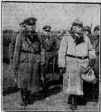
Hindenburg legújabb fényképe szombaton készült a moabiti frontnál gyakorlótérén.

A 85 éves elnök táborognyi uniformisban áll a berlini övezet frontján. A kép baloldalon Hammerstein tábornok, a német vezérkér főnöke.