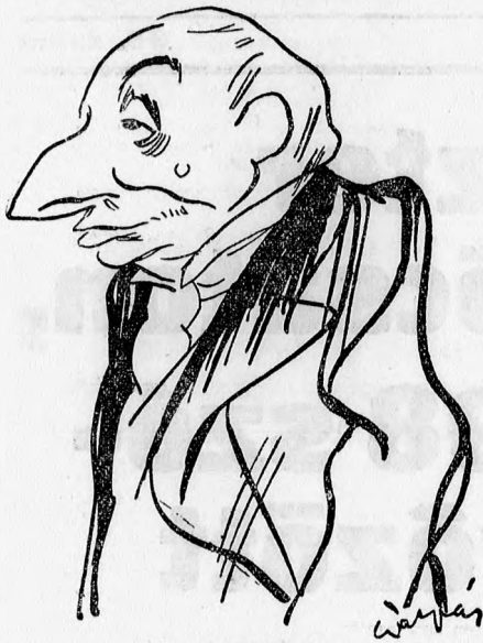
Purgly miniszter, a kormánypart jelöltje (Gáspár Antal rajza A Reggel számára.)

'A választás napja pedig teljes rendben és nyugalomban telt el és a teljesített idegek