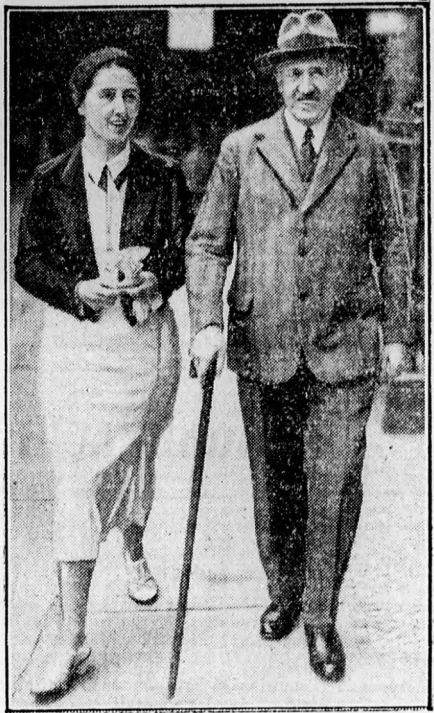
Schleicher tábornok vidám sétája feleségével kancellárrá való kinevezése reggelén.