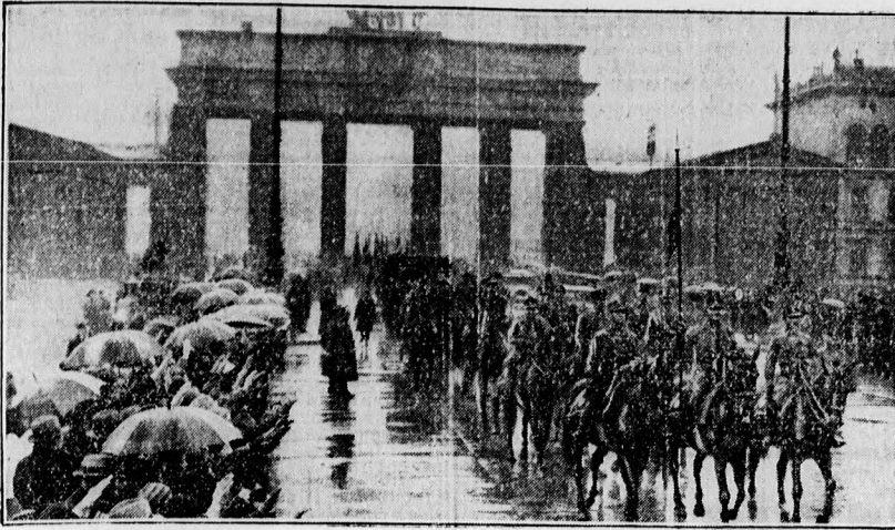
A nemzeti szocialisták lovas rohamesapatát üjjongó tömeg üdvözlí a brandenburgi kapunál