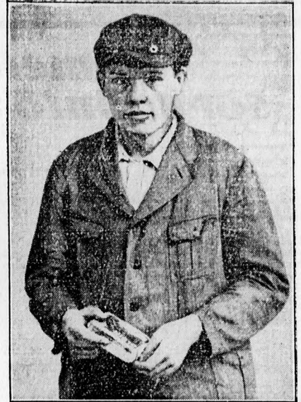
a parlamenti palotát felgyújtó holland kommunista halálra ítélik