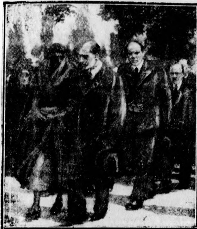
A család a gyászmenetben

akik nem akartak élni egy percig sem egymás nélkül. A smaragd zöld temetőben 4-500 ember szorongott, feketeruhás sokaság a ravatalos ház