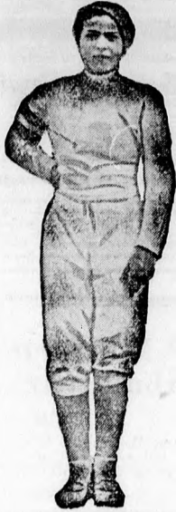
Elek Ilona vasárnap megszerezte az első Európa bajnoki győzelmet Magyarországnak!