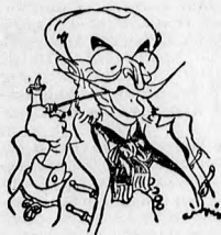
(Gáspár Antal rajza A Reggel számára)