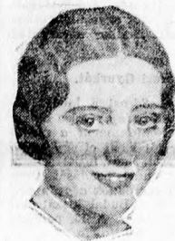
A vörös bestia