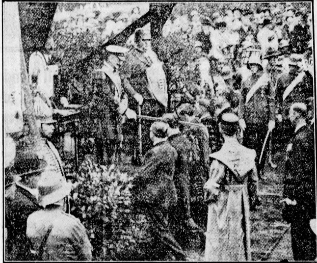
»Hadúr nevében vitézzé ütlek...«

Néhány perccel kilenc óra előtt érkezett meg a kormányzó, majd pontban kilenckor kürtzso jelezte a kormányzó jövetelét. A roskadásig megtelt tribünökön napfény nélkül is csillognak-villognak az érdemrendes egyenruhák, közöttük tarkálnak, mint valami színes virágcsokor, a bolgár tornászok fehérprómes, piros sapkái... A diszpályában a kormányzói páron kívül Gömbös Gyula miniszterelnök, Imrédy Béla pénzügyminiszter, Keresztes-Fischer Ferenc belügyminiszter, Hóman Bálint kultusz- és Lázár