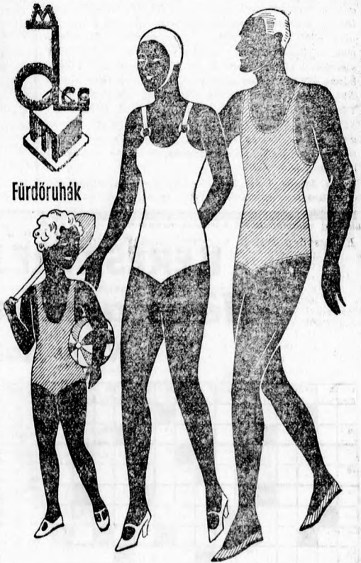
Az Em-Dé-Cse család fürdőruhában