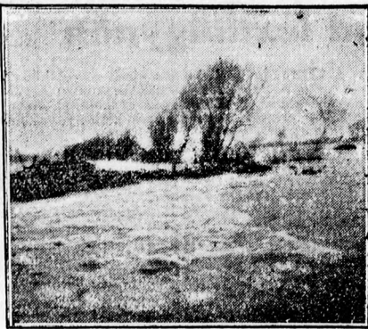
Az árvíz elborítja a tokaji országotat...

har, kemény zörgéssel korbácsolta a fákat és a tetőket. Aztán megjött a jég.