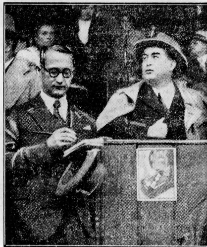
Gömbös miniszterelnök nyilatkozik A Reggel munkatársának

már sejténé, hogy ez a fiatal ember lesz az, aki két góljával — betegen is — eldönti a nagy csata sorát. Usetty viszont Toldiban bízik, egyelőre hiába. Az osztrák csapat egyik szép támadást a másik után vezeti, a közönség rossz sejtelmét igazoltatnak látszanak. A miniszterelnöknek nyomban feltűnik a bécsi center-mesteri játéka: