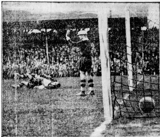
Magyar gól a Wundermannschaft hálójában

A bécsi kirándulók határtalan önbizalommal, biztos győzelemre érkeztek