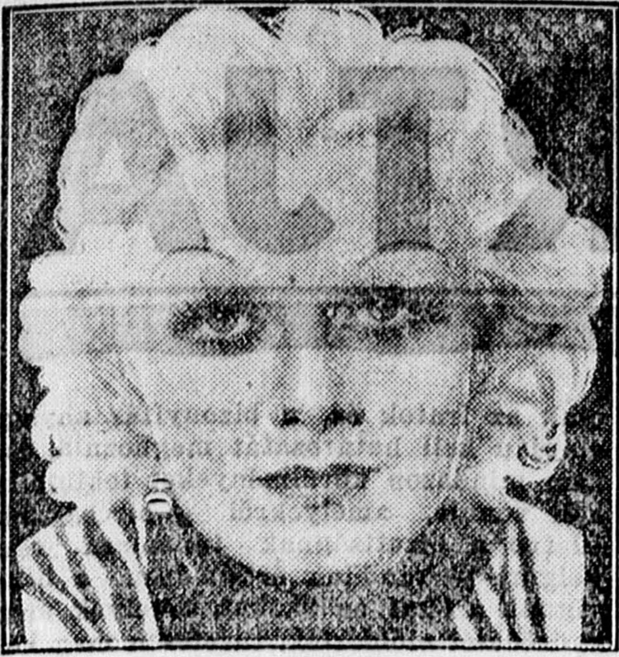
Jean Harlow az amerikai »szőke mérreg«