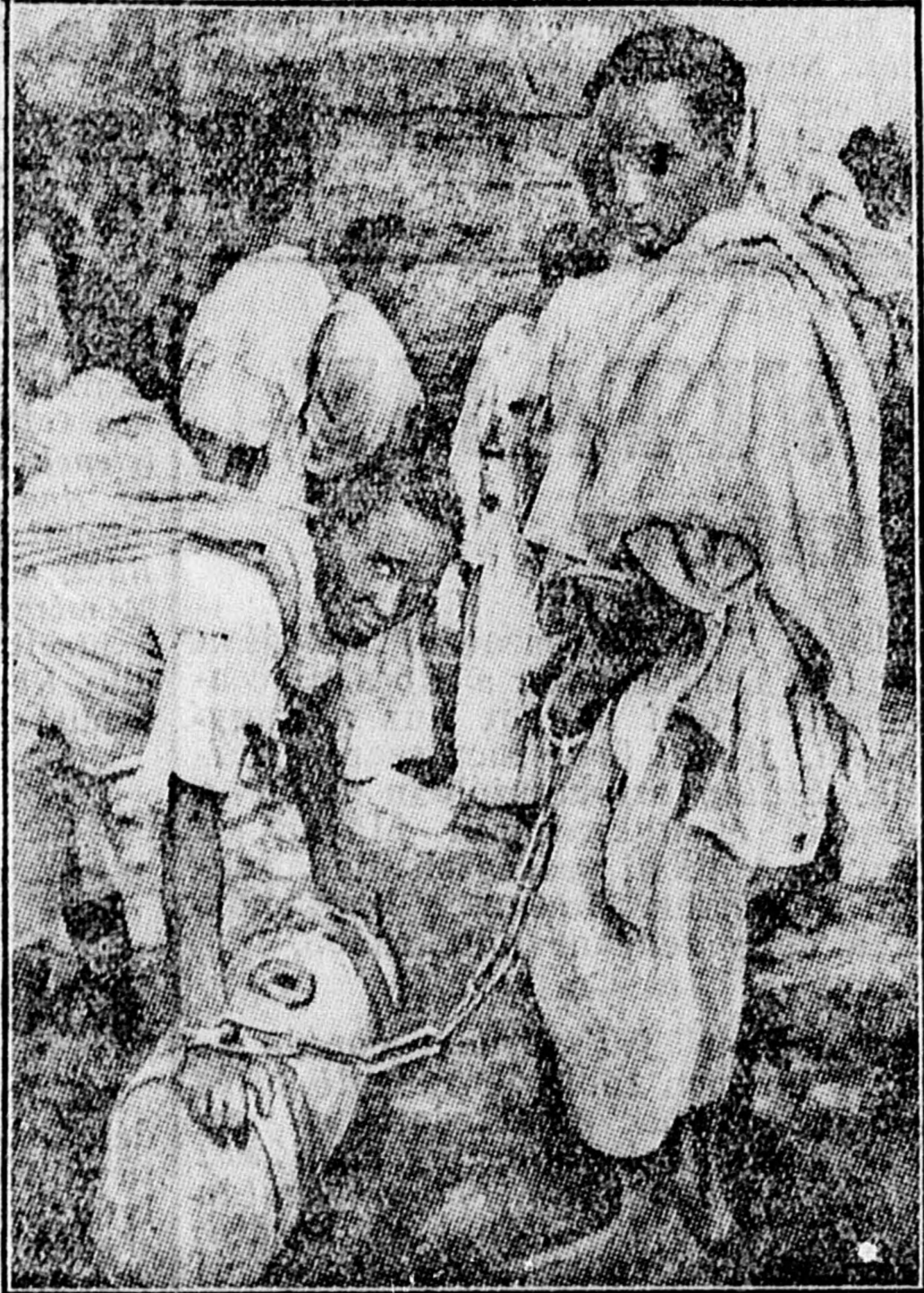
Igy bánnak az adósokkal Abessziniában!

ben az igazságügyminiszter, Afa né-gus személyesen ítél, a főbenjáró ügyekben pedig maga a császár. Hal-lottam a császárt ítélkezni, egy halá-