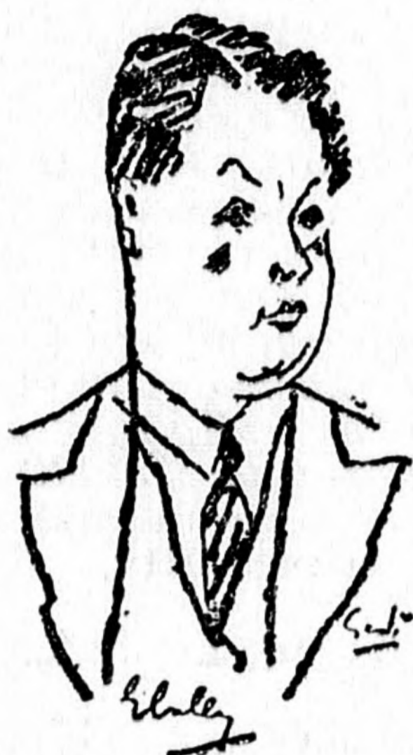
Gedő rajza 'A Reggel' számára.

Ez a kissé pufók képű, mosolygós fiatalember, — egyébként hatalmas termetű, kékszemű atléta, tipikus oxfordi evezős! — igen előkelő közéleti férfi: M. P! Vagyis: az angol parlament tagja, Member of Parliament.