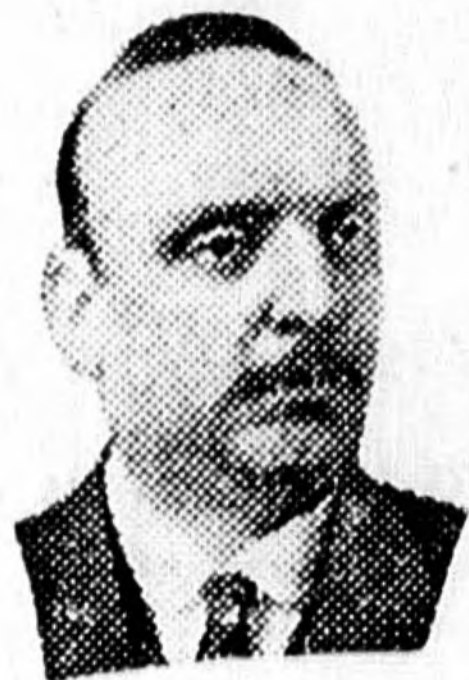
A tervek szerint

(A Reggel tudósítójától.) Az olasz királyi pár májusra tervbevetett budapesti látogatását néhány héttel meg fogja előzni Miklas osztrák szövetségi elnöknek utazása, amelynek időpontjára, tartamára és programjára vonatkozólag a két kormány nagyjából már meg is állapodott egymással.