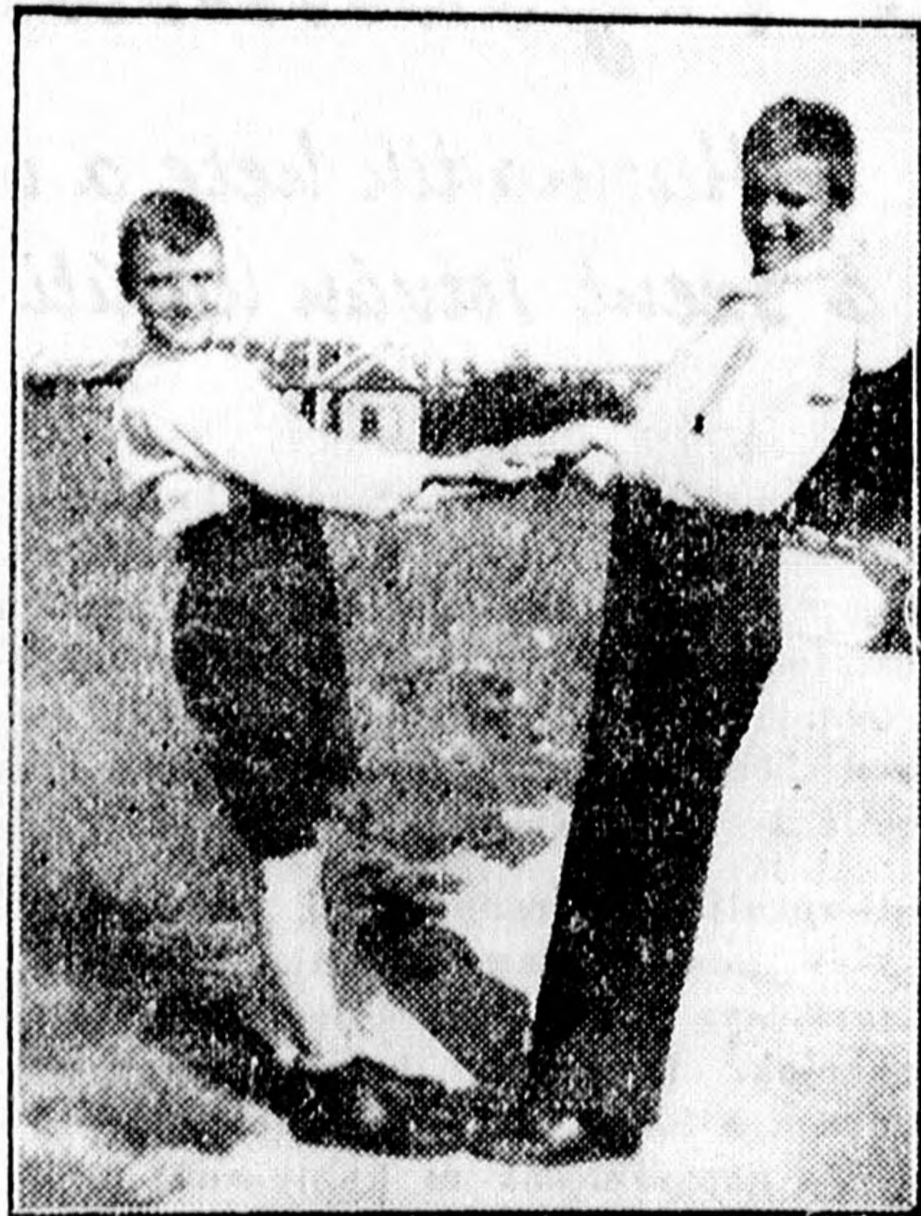
A két Zsidó-fiú, a nagyobbik tünt el a Balatonon

biztos, hogy a művész nem egészen úgy mondta el a dolgokat, ahogy azok történtek.