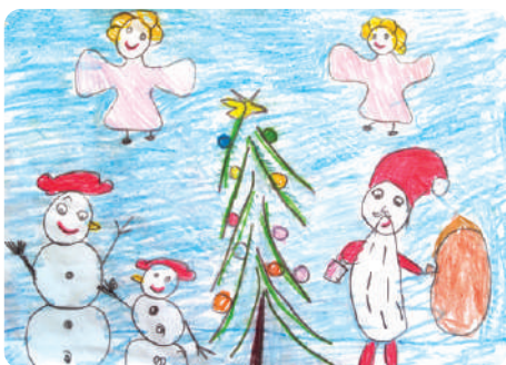
Dobai Lilla, Szilágyfőkeresztúr