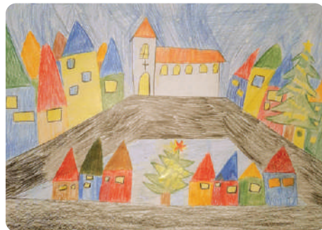
Székely István, Négyfalu