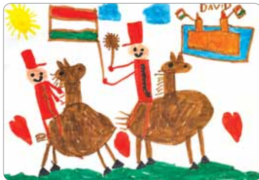
Sonka Dávid, Kolozsvár