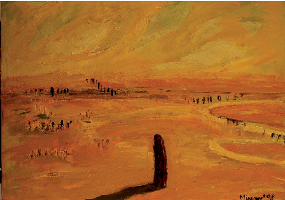
Varga Patricia Minerva: A fekete bojtár számkivetettsége (sorozat — olaj, vászon)

Megnevez, karjába vesz, felnevel, aztán ott felejt, rosszabb, ha direkt, de az sem jó, ha véletlen, ahol nincs meleg paplan, sem hideg vermek, ahol nem simogatnak, de nem is vernek, ahol anya tejet nem tölt, apa kenyeret nem szel, ahol mások döntik el, hogy kilenc óra negyventől nem lesz.