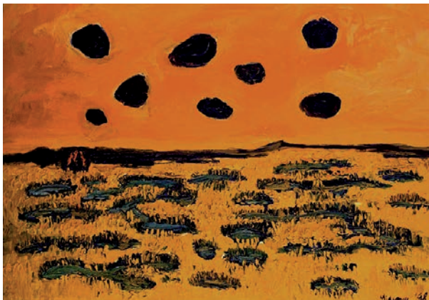
Varga Patrícia Minerva: A fekete bojtár számkivetettsége (sorozat — olaj, vászon)

Mi házasodtunk meg először. Nekünk születtek gyerekeink először. A házasságunk nekünk ment taccsra először. Mi kerültünk kórházba először. Mi halunk meg először.