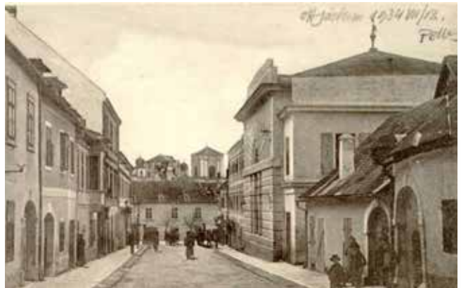
Zsidó utca Kismartonban (Burgenland)

35 Az eredetiben: licht (ליכט). Komoróczy fordításban: „fényt”. „Ünnepen nem szabad fényt (tüzet) gyújtani, de