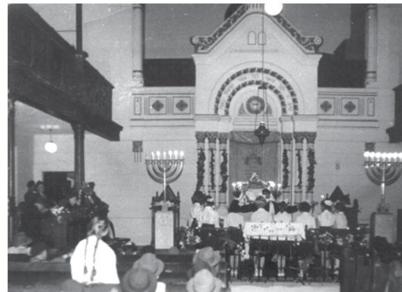
Kaposvári leányavató 1960-ban

A 20. századfordulós neológ zsidó sajtó – és a hitközség is – eleinte konfirmációnak, majd a későbbiekben főleg fogadalmi ünnepségnek nevezte ezt a leányokról és leányoknak szóló kvázi bát micvá programot, mely hosszú évtizedekig, a vészkorszak után is megmaradt a neológia hagyományaiban. Az Új Élet tavaszi felhívásai között még a '90-es években is szerepelt, hogy a 12 éves korukat betöltött lányok jelentkezését várják a hitközségükön, akiknek jellemzően Sávuot első