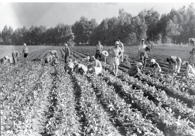
Betakarítás Izraelben, 1960

Cvi Hirs Kalischer rabbi (1795–1874) a smitá egy további előnyére hívja fel a figyelmünket: