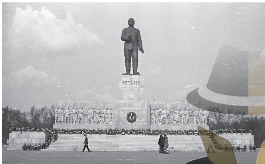
Sztálin szobor Budapesten.