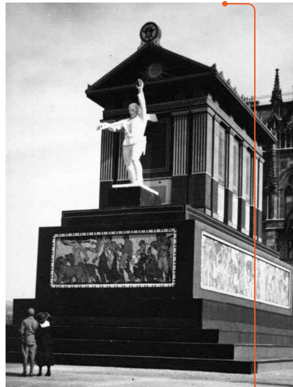
Andrássy Gyula szobra fölé épített „Munka Háza” című 1919. május 1-jei díszlet

Magyarország legnagyobb zsidó közössége, a Pesti Izraelita Hitközség vezetése, amennyire azt a cenzúra és a 133 napos rémuralom engedte, a leg-