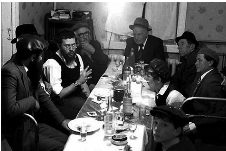
Titkos fábréngen 1983-ban

földalatti zsidó iskolát: chédereket, vagyis alapvető zsidó oktatást nyújtó iskolákat, csakúgy mint jesivákat, azaz felsőfokú zsidó oktatási intézményeket alapítottak és működtettek, rejtett mikvéket (rituális fürdő) tartottak fenn, hogy a vallásos családok betarthassák a házasság tisztaságának törvényeit. E mindenre elszánt emberek, akik között férfiak és nők egyaránt voltak, mindenüket kockára tették azért, hogy megőrizzék a jiddiskájt , vagyis a zsidóság szikráját az óriási kiterjedésű ország több száz városában és településén.