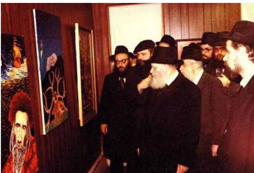
A Rebbe Báruch Náchson kiállításán