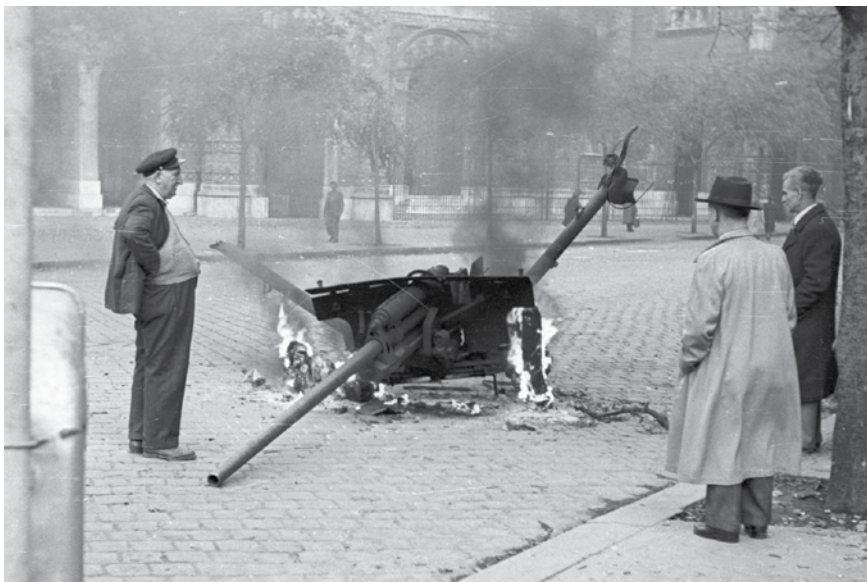
1956, Lángoló páncéltörő ágyú a Dohány utcai zsinagóga előtt

A GPU és később az NKVD éveken keresztül falakba ütközött, amikor a lubavicsi haszidok ellen vették