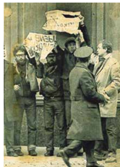
Szovjet rendőrök feloszlatják a refjuznyikok tüntetését a Nemzetközi Ügyek Minisztériuma előtt, 1973. január 10.

Amikor a Rebbe színre lépett, már javában folyt a kommunista hatalom egyik legnagyobb és legátfogóbb zsidóellenes hadművelete, az orvosper. Ennek során több mint 50, többségében zsidó orvost vádoltak meg azzal, hogy Sztálin életére törnek. A per 1948-ban indult és végző felvonása előtt, Sztálin halálával ért véget. A megvádolt orvosok közül sokakat megölték, az események hatására rengeteg zsidó vagy zsidó-