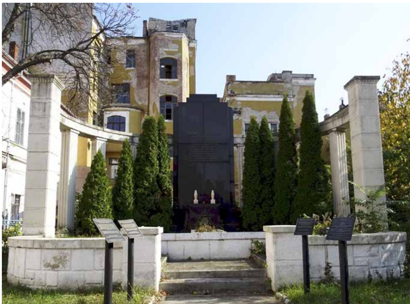
A nagyváradi holokauszt-emlékmű

Bár a holokauszt után közvetlenül sok helyen állítottak emlékművet a mártíroknak, később ortodox közösségekben már nem így emlékeztek meg róluk, hanem zsinagógákat, iskolákat, Talmud Tóra épületeket emeltek a tiszteletükre. Van, aki az egész iskolát, mások egy-egy osztálytermet vagy kisebb részt finanszíroznak szeretetik emlékére. Más családok egy szent könyv kiadásához járulnak hozzá az elhunyt mártírok emlékére. Az épületek falán látható emléktáblán pedig szerepel egy felirat, miszerint mindaz a tóratanulás és ima, ami ezek közt a falak között elhangzik, legyen a meggyilkolt javára írva.