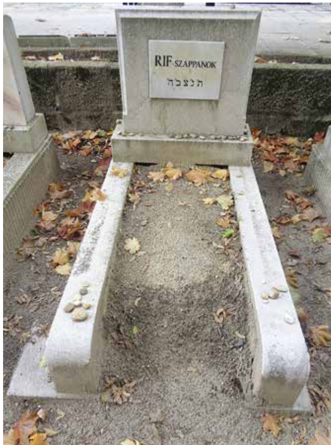
RIF szappanok sírja a Kozma utcai temetőben

Érdemes itt megjegyezni a RIF szappanról, hogy sokáig tartotta magát a nézet, miszerint neve a „Reines Jü-