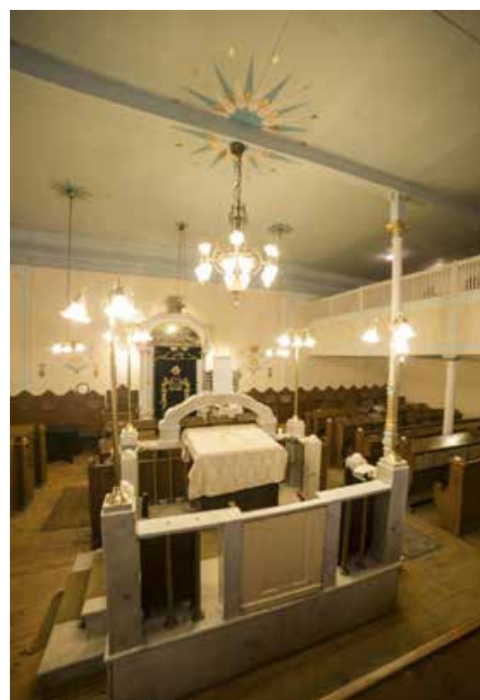
A zsinagóga napjainkban

A vészidőszak vihara, majd a kommunizmus vallást üldöző szintén nehéz évei elsodorták a Bikur Cholim 70. évfordulójára kiadott emlékkönyvét. Állíthatjuk, hogy ezt nem volt nehéz, hiszen a magyar és héber nyelvű tanításokban gazdag könyvet mindössze 200 darab számozott példányban adták ki. Így aztán az egyesület és az imaház pontos, tényszerű adatai a feledésbe merültek, azonban a szóbeszéd megőrizte a Dessewffy történetét, sőt valóságos folklórt alakított köré, mely a vörös