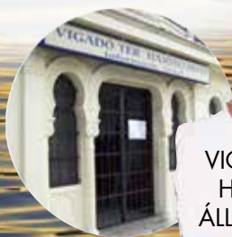
VIGADÓ HAJÓ- ÁLLOMÁS

– „Komolyan? Azt hittem, hogy ő Izraelben élt. Na várj... Itt azt írják, hogy Budapesten született huszonegyben, és a Veres Pálnéba járt, na pont, mint anyu... Egy textilvegyésszel házasodott össze, de házasságuk csak alig hat hétig tartott, mert a férjét munkaszolgálatra vitték. Azt hitte, meghalt. A holokausztot Svájcban élte túl, ott újraházasodott és ötvenegyben Izraelbe mentek. Majd kilencvenben vendégkiállítása volt a Vigadóban, ahol... hát ezt nem hiszem el... mindjárt első-