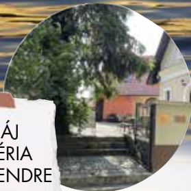
CHÁJ GALÉRIA SZENTENDRE