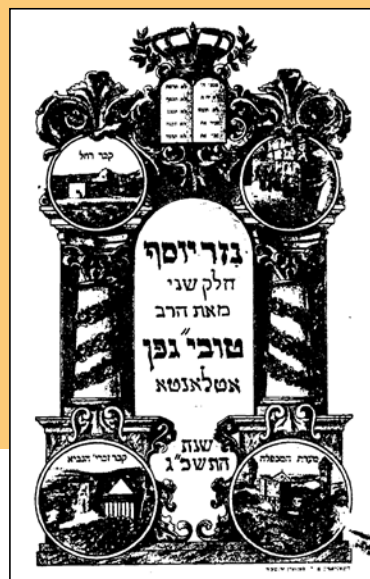
Geffen rabbi 1963-ban megjelent cenzúrázatlan responsuma