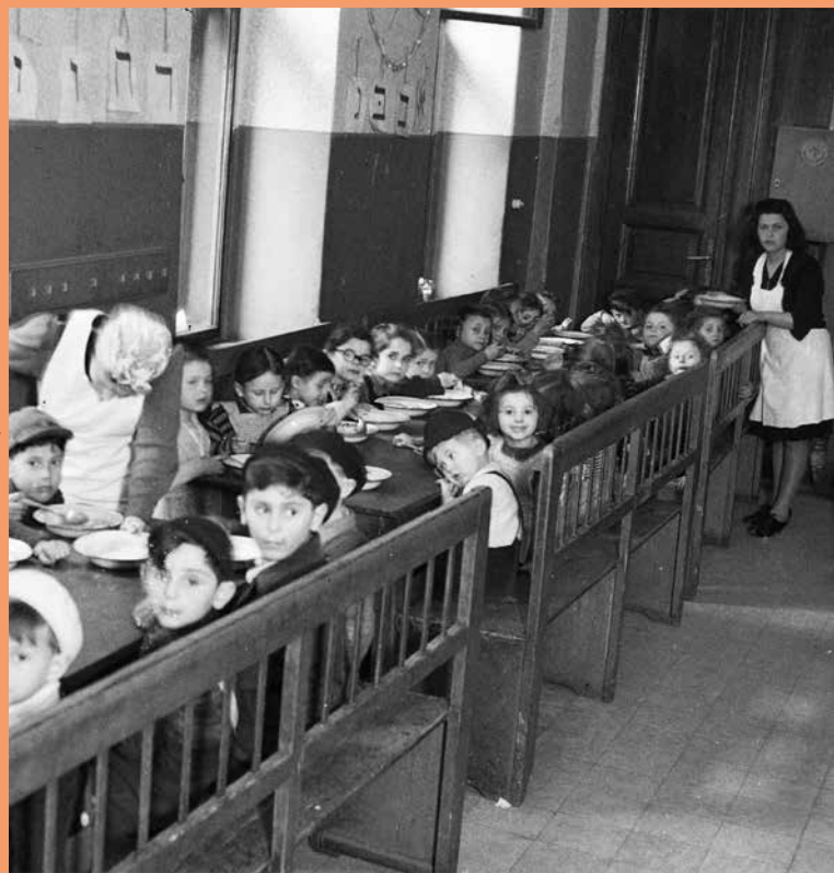
A Hanna még a Kertész utcában, 1946-ban

KÉPSZÁM: 105253