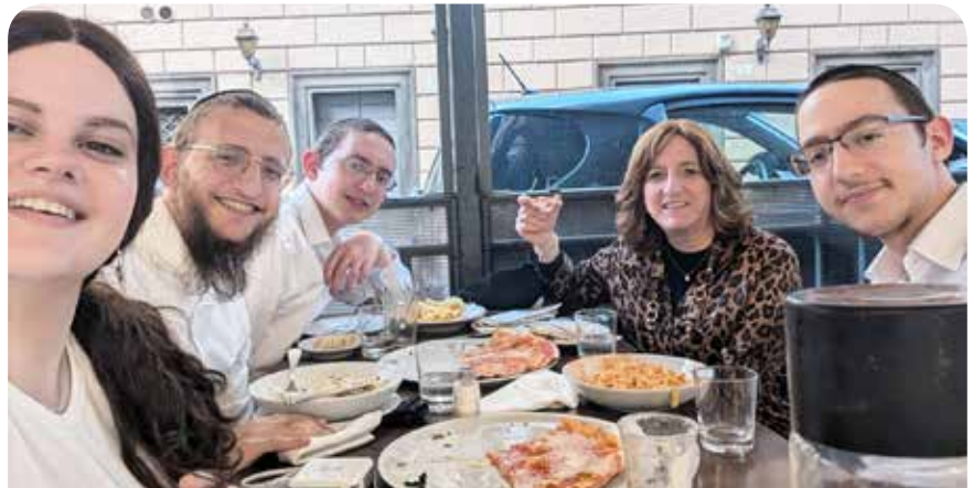
FIAIVAL ÉS MENYÉVEL

– Szerintem az a kivétel, ha valaki nem segít. Nem is lehetne egy nagy családot menedzselni, ha a férj nem csinálna semmit. A haszidizmusban ezen kívül van egy olyan útmutatás, hogy a férjnek minden nap kell egy órát gondolkodni a gyerekek