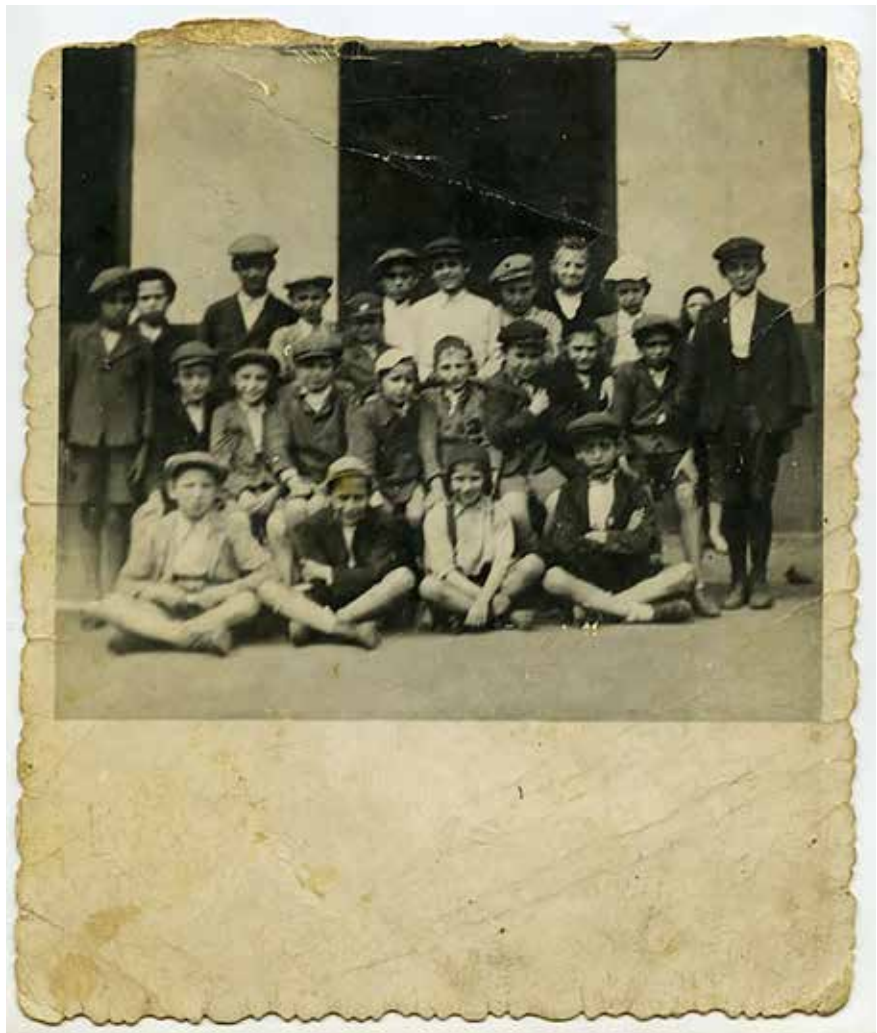
A JESIVA-ELŐKÉSZÍTŐ TALMUD-TÓRA 1943/44 TELEN

A miskolci hitközség vázlatos soraiban is említést kell még tenni arról, hogy 1887–1888 között önálló szefárd, azaz haszid hitközség is volt