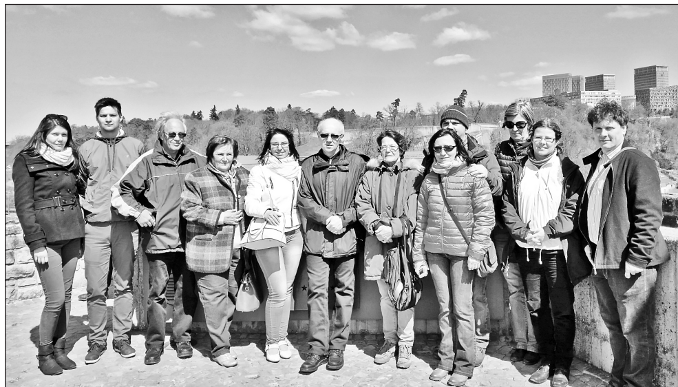
Zarándoklaton a kölni magyarok