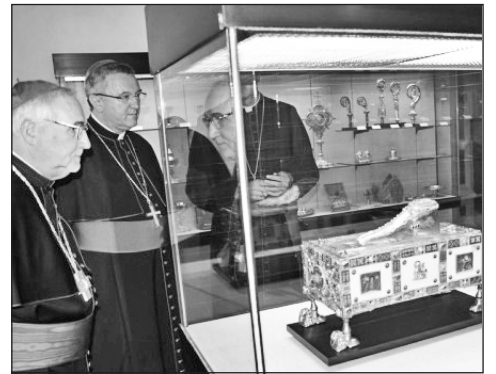
Szent András apostol sarujánál a trieri dóm múzeumában

A püspök a város megtekintése során Gebhard Fürst Stuttgart-Rottenburgi püspökkel (akit sokan Szent Márton tiszteletének egyik legaktívabb német apostolának tekintenek és ebből az alkalomból ő is eljött Trierbe) megtekintette az úgyneve-