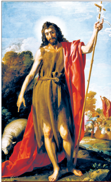
Keresztelő Szent János Ünnep: június 24.

„Izajás próféta megírta: Nézd, elküldöm követemet, hogy előkészítse utadat. A pusztában kiáltónak szava: »Készítsétek az Úr útját, tegyétek egyenessé ösvényeit!« Keresztelő János a pusztában hirdette a bűnbánat kereszttségét a bűnök bocsánatára.” (Mk 1,1–4). Így hangzik az evangéliumokban az Apostolok Cselekedeteiben megőrzött régi igehirdetési formulák egybehangzó tanúságtétele: Jézus nyilvános föllépésének kezdetei Keresztelő Jánosnak a Jordán mellett indított bűnbánó mozgalmába nyúlnak vissza.