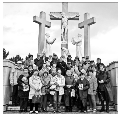
A Magyar Keresztútnál