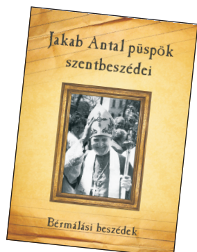
II. kötet Bérnálási beszédek (312 oldal, keménytáblás)

A kétkötetes gyűjteményben a szerkesztők Jakab Antal püspöknek a gyulafehérvári érseki levéltárban rendelkezésre álló hagyatékát igyekeztek a teljesség igényével feldolgozni. Céljuk elsősorban Jakab püspök segédpüspöki és megyéspüspöki idejének ilyen irányú dokumentálása volt, illetve hogy e két évtizedben (1972–1992) elhangzott és az irathagyatékban megtalálható prédikációit mindenki számára hozzáférhetővé tegyék. Akik hallották őt beszélni vagy olvasták írásait, szembesülhetnek a sajátos Jakab Antal-stílussal; a szerkesztők ezt igyekeztek hűen visszaadni, a szövegek eredetiségét megőrizve. A gyűjteményhez Jakubinyi György gyulafehérvári érsek, Jakab Antal püspök mai utódja írt előszót.