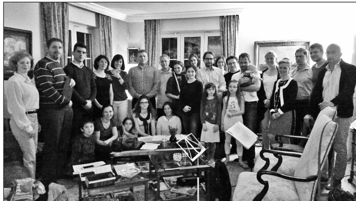
Növekszik a brüsszeli magyarok létszáma

Pár évvel ezelőtt megfogalmazódott az igény, hogy ne csak vasárnaponként, a nagy közösségben, hanem hét közben is összejöjünk, végezzünk közös imádságot. A brüsszeli közösségben több imacsoporthoz tartozunk. Ezek nem a Magyar Házban, hanem magánlakásokban gyűlnek össze, ezzel is hangsúlyozva az összejövetelek családi jellegét. Az imakörök a résztvevők, vagy valamelyik „alapító család” kezdeményezésére szerveződtek. Nyitottak, szívesen és örömmel fogadják új jelentkezőket. Két csoport vezetőjét kértem meg, hogy mutassák be röviden közösségüket.