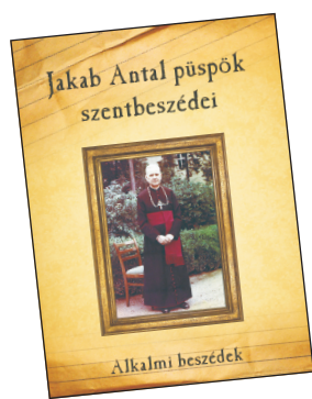
I. kötet Alkalmi beszédek (464 oldal, keménytáblás)