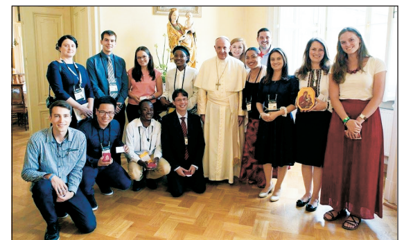
A pápa fiatalokkal a krakkói érsekségen

Ahogy a magyar zarándokokat fogadó egyházközségek vezetői elmondták, az Ifjúsági Világtalálkozó nemcsak a külföldről érkező fiatalokat mozgatta meg, de a vendéglátó plébániákra és településekre is hatással volt. Az Ifjúsági Világtalálkozót több ezer, a világ minden tájáról