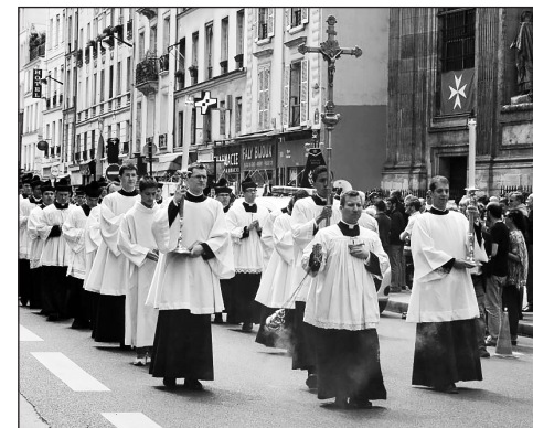
Körmenet Szent Márton ereklyéjével