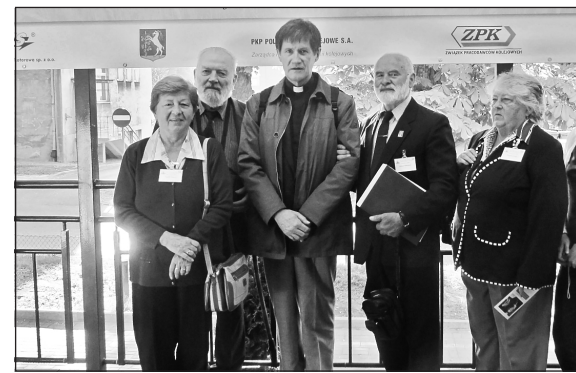
A magyar és a lengyel delegáció képviselői

Fehéroroszország – hivatalos magyar nevén Belarusz Köztársaság – a nyugatabbról érkezőknek elzártsága miatt legalább olyan egzotikus úticél lesz majd, mint 25 évvel ezelőtt talán Lengyelország volt. A Vasutas Kongresszusok programjában ugyanis a közös ima, szentmi-