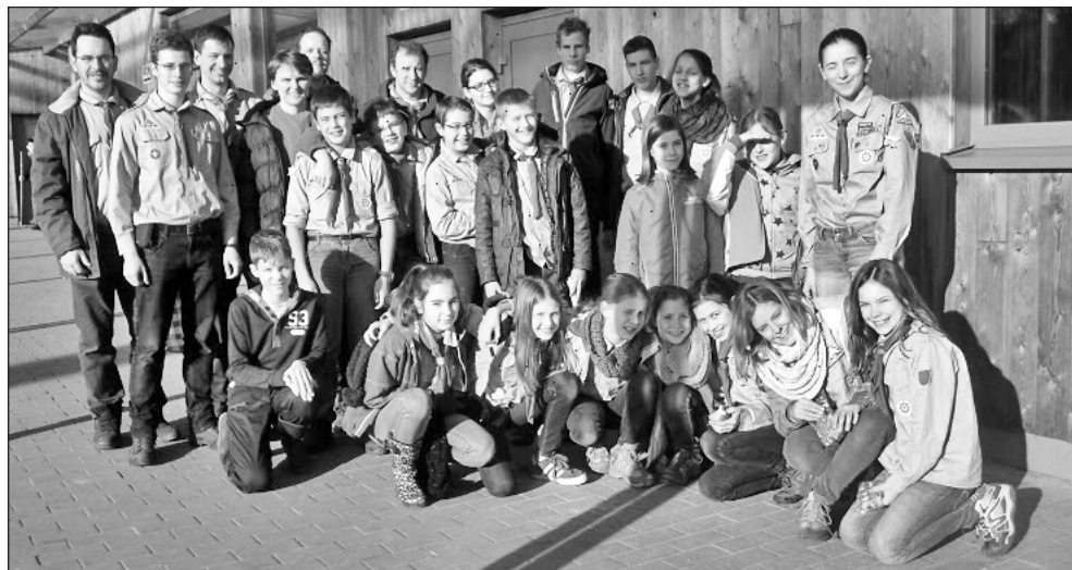
A belgiumi magyar cserkészcsapat tagjai

A lelkész elérhetőségei: Tel.: 00 32 487 614 063 E-mail: havas@piar.hu