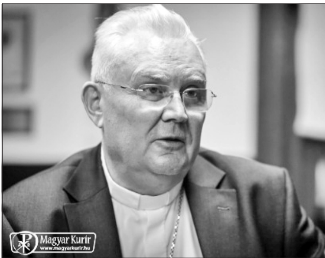
„Missziós lelkületre van szükség”

– A külföldi magyar lelkipásztori szolgálatban, Ausztráliát és Dél-Amerikát is beleértve, összesen 15 magyarul nem beszélő pap végez magyar lelkipásztori szolgálatot. Ez nagyon is lehetséges, ha a nyelvünket nem beszélő papnak igazi jó magyar szíve van, ilyenkor ez nem okoz semmiféle feszültséget. Ez főleg akkor megvalósítható, ha a magyar hívek elkötelezett módon vesznek részt az egyházközség életében; vannak magyar egyházközségek, ahol majdnem mindent a hívek végeznek, megszervezik a szentmiséket, a ministránsok és lektorok csoportját, az énekkart, az ünnepségeket és egyéb kulturális találkozókat, még a cserkészteket, a magyar iskolákat is, természetesen a plébános irányításával és vezetésével. Az észak-amerikai katolikus közösségek – hasonlóan más nyugati gyülekezetekhez – mélyen elkötelezettek a közösségek építésében. Ez itthon is példa lehet.