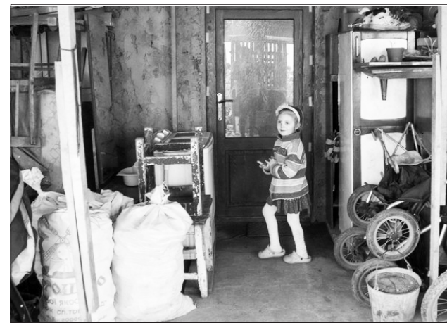
Sok ezer család él nehéz helyzetben Kárpátalján