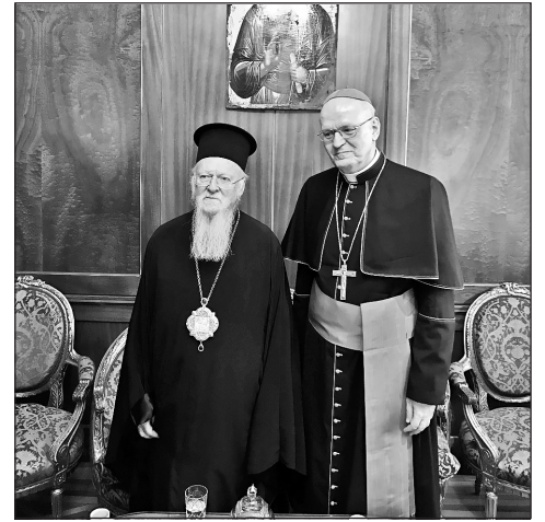
Az álláspontok közel állnak egymáshoz

– Ez a katolikus–ortodox fórum legutóbb Párizsban volt. Ezen részt vett bíboros úr, de ettől függetlenül, hogy a kapcsolataink Bartholomaioszsal és az ortodoxiával kiválóak, mondhatjuk ezt a Magyar Katolikus Egyház vonatkozásában.