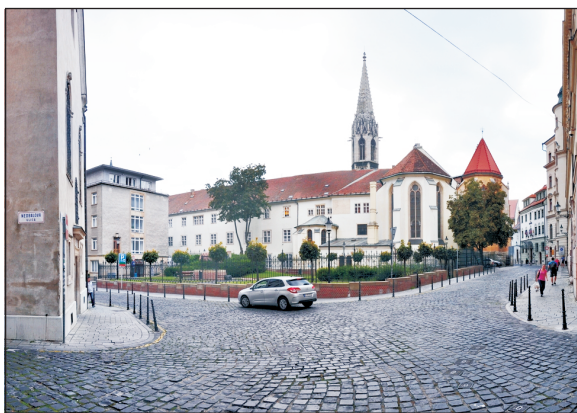
A pozsonyi ferences templom