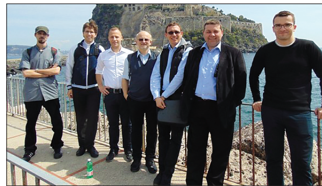
A PMI-ösztöndíjasok Ischia szigeténél

Az ösztöndíjasok ellátogattak a nápolyi-öbölbeli Ischia szigetére, a Szent Januáriusz vértanú püspökről elnevezett székesegyházba és a föld alatti Nápolyba is. A résztvevők beszámolója szerint útjuk lelki csúcspontját a San Severo-kápolnában található Fátolos Krisztus-szobor jelentette.