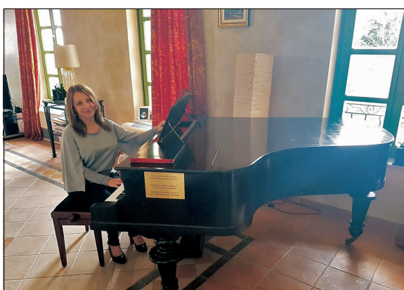
Rost Andrea operaénekesnő adományozta