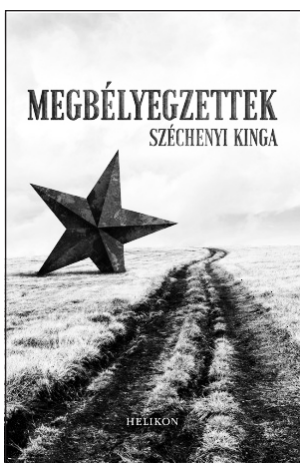
A kötet borítója

megpróbálják barátoknál, ismerősöknél letétbe helyezni. Lakásuk berendezésére ugyanis az állam tette rá a kezét, illetve azok birtokába került, akiknek a számára kiutalták a lakást. Ők elsősorban a fegyveres testületek különféle vezetői, központi parancsnokai, valamint az arra érdemes pártaktivisták voltak, a maradékot pedig munkások és családtagjaik között osztották szét, persze csak hármast, sőt négyest, ötös társbérletként. A kitelepítés alól elvben mentesítést lehetett kérni, azonban az esetleges felmentést is azok adhatták, akik az akciót 1951. május végén váratlanul megkezdték és irányították.