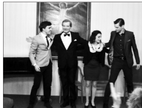
Az április 22-i előadáson