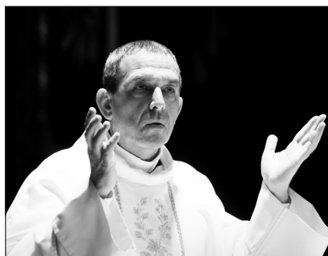
„Közel áll hozzám a zene”

Janó atya bécsi szolgálatának is legfőbb jellemzője a sokoldalúság, sokrétűség: a lelki gondozást, a katolikus egyház ausztriai képviselőitében való példaértékű szerepvállalását sokféle közéleti tevékenységével teszi gazdagabbá. Szándéka: szeretetben szolgálni a mindennapokban és a művészeteken keresztül is a lelkek üdvösségét. Mindszenty József emlékének és szellemi hagyatékának ápolása tényleg élen jár. Évente megemlékezéseket szervez a bíboros-hercegprímás Bécsbe érkezése (1971. október 23.) és az irgalmas rendiek kórházában négy évvel később bekövetkezett halála (1975. május 6.) évfordulójához kapcsolódóan, és más alkalmakat is megteremt arra – például könyvbemutatókat szervezve –, hogy a sokat szenvedett, meghurcolt főpap hűsége,