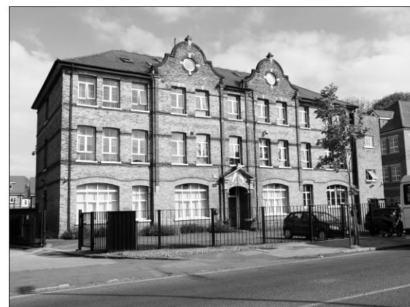
A londoni Szent István Ház