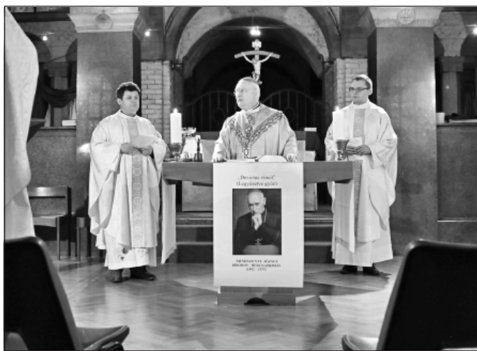
Cserháti Ferenc püspök szentbeszédében az üldözött bíborosra emlékezett

szünetéstörténetével felfedte a kommunista diktatúra igazi arcát, amit nyugaton nem ismertek. „A magyar prímás – írta a Times – nem akarta befolyásolni a világpolitikát, de szenvedése, megpróbáltatása világpolitikai jelentőségű lett”, és „a demokrácia hősenek” nevezte a magyar főpapot. A westminsteri katedrálisban, ahol most vagyunk, Heenan bíboros a maga trónszékét engedte át Mindszentynek és a többbezes templomi közösség előtt a bíboros védelmére kelt azokkal szemben, akik őt a szabad világban is el akarták hallgattatni, és kijelentette: ha a világkommunizmus öszintén akarja a békét, akkor hívja haza népéhez a bíborost, „mert Mindszenty ennek a népnek atyja és hőse”. A szomszédos parlamentben Winston Churchill képviselő, a nagy államférfi unokája 140 képviselő-