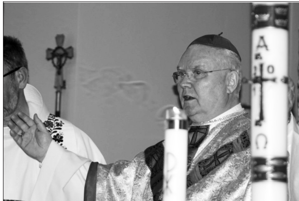
Szent Lászlóról is megemlékezett a püspök