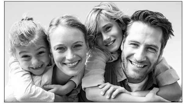
A család visszaadja a reményt az embernek

A 20. században kezdett végre ismét megjelenni a művészetekben, főképpen