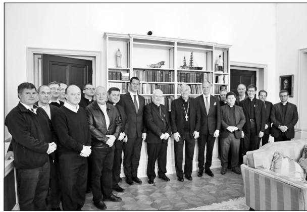
A csoportot fogadta Vincent Nichols bíboros