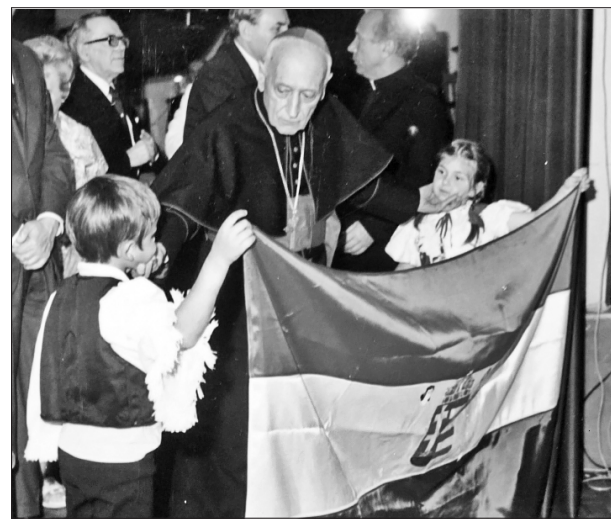
Mindszenty József bíboros 1974-ben történt látogatása