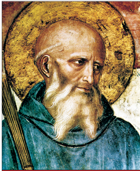
Szent Benedek apát, Európa fővédőszentje Ünnepe: július 11.