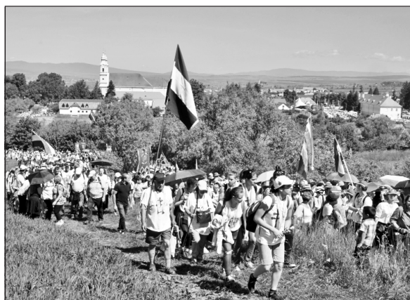
Zarándokok útbán a csíksomlyói búcsúba