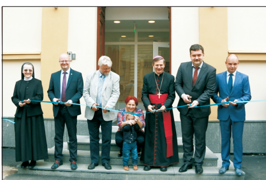
Átadták a központ felújított épületét

Szalagvágással, áldással, beszédekkel és bemutató sétával adták át a Boldog Scheffler János Központ felújított és kibővített épületét május 25-én Szatmárnémetiben. Az egészségügyi, fejlesztő és szociális központot a Páli Szent Vincéről Nevezett Szatmári Irgalmas Nővérek Társulata üzemelteti. Az öt éve működő intézmény átalakítását tavaly tavasszal kezdték meg. A munkálatok során a zárdaépület jobb szárnyát teljes egészében megújították, a termeket a rehabilitációs és fejlesztőközpont igényei szerint alakították terápiákra alkalmassá, birtokba véve a tetőtér hasznos tereit is. □