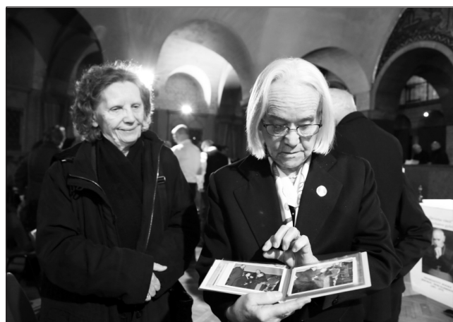
Akik még személyesen találkozhattak Mindszenty bíborossal Londonban

A budapesti Amerikai Nagykövetség elhagyása után, 1971-ben az emigrációba kényszerült bíboros egyedülálló felvilágosító munkát végzett Nyugaton a kommunizmus iránt hiszékeny emberek körében. Magyar embernek talán soha sem volt az övéhez hasonló hírneve a nagyvilágban, és ezt még ma is lépten-nyomon tapasztalom, amikor hozzá hasonlóan járom a világot magyar testvéreim szolgálatában. Nevét ismerik, és nem csak a magyar körökben: a külföldiek szemében Mindszenty a szabadság jelképe, Mindszenty és a magyarság gyakran ugyanaz. Tekintettel megemlékezésünk jelenlegi színhelyére a westminsteri katedrálisban, ma csupán a száműzött bíboros londoni, illetve angliai lelkipásztori látogatásának (1973. július 14–20.) visszhangjára és méltatására szeretnék röviden kitérni. Londoni útja kezdetén a Times tekintélyes cikkben köszöntötte a magyar prímást: „A fiatal Mindszentyt édesanyja arra tanította, hogy minden ember egyenlő, s a jognak minden körülmények között érvényesülnie kell” – indította méltatását a Times. Aztán kiemelte, hogy Mindszenty szentbeszélte mindenféle totalitarizmussal, és