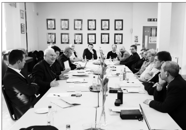
Munka közben a konferencia résztvevői a Szent István Ház nagytermében