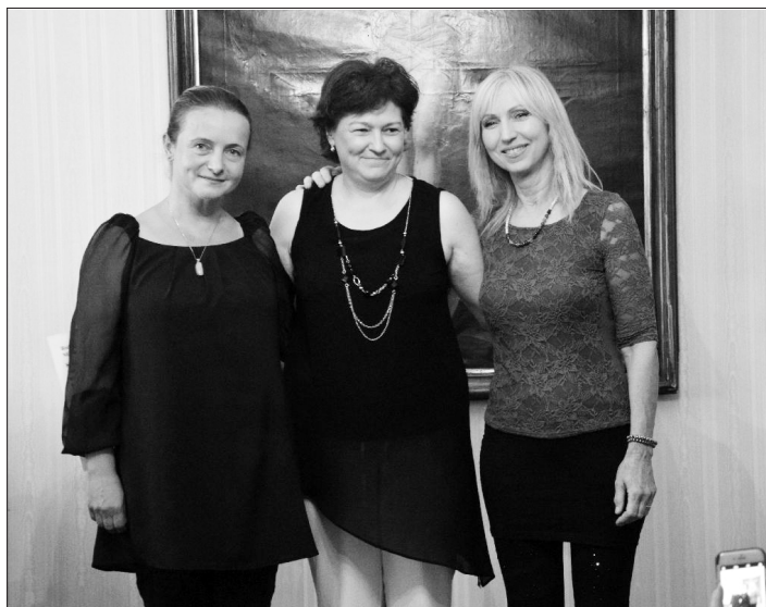
Határon innen és túl: az est szereplői a nemzet egységét jelképezték

kus lelkészségek országos igazgatója vázolta, mit adott az érintett ausztriai magyar katolikus lelkészségeknek az elmúlt két év és a két program. Kifejtette: római tanulmányait követően, az 1970-es években, amikor gyulafehérvári teológiai tanárként és vicerektorként megismerte a külföldi magyar katolikus pap-ság tevékenységét, láthatta, hogy azok a lelkipásztori feladatok ellátása mellett mennyi időt és energiát szentelnek a magyar közösségek identitás megtartására: nótáesteket tartanak, egyesületeket hoz-