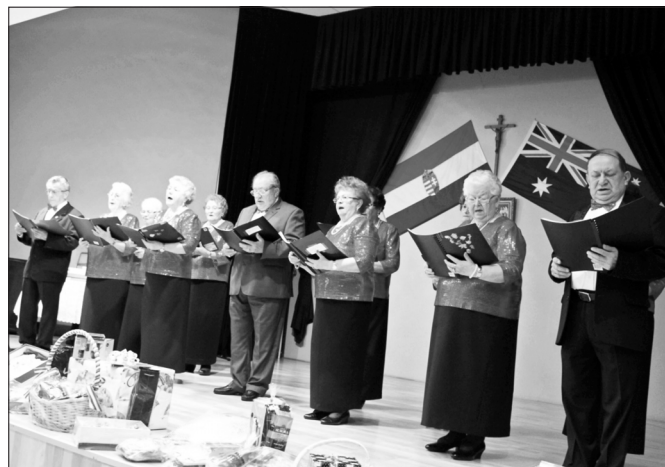
Minden évben megrendezésre kerül az úgynevezett Katolikus Ebéd, amelyen közösségünk tagjai kulturális műsorral teszik emlékezetessé a közel 300-400 honfitársunk napját.