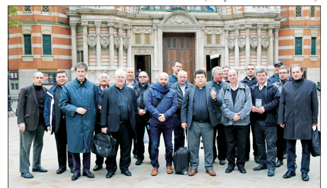
A Westminster-katedrális előtt