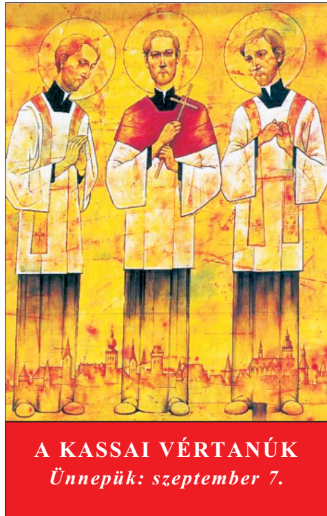
A KASSAI VÉRTANÚK Ünnepük: szeptember 7.

Körösi Márk: sz. Krizevac (Horvátország), 1588. Grodziecki Menyhért: sz. Czeszyn (Szilézia), 1584. Pongrácz István: sz. Alvinc (Erdély), 1582. Meghaltak: Kassa, 1619. szeptember 7.