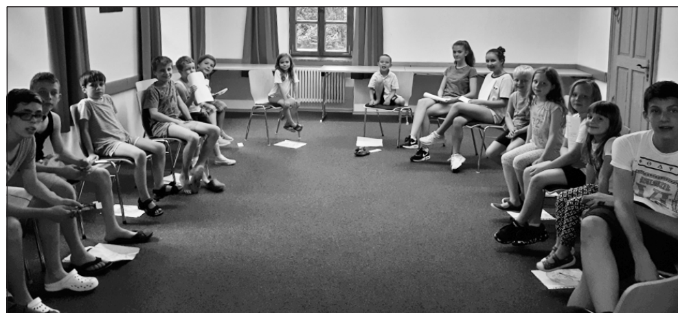
A lelki hétvégén új ismeretekkel is gazdagodtak a gyermekek