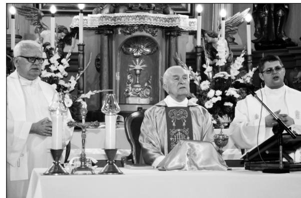
1973-ban lett a Benelux államok főlelkésze