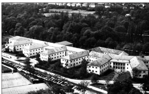
A Szabad Európa Rádió épülete Münchenben

– A Szabad Európa Rádió különleges szerepet játszott a rendszerváltás előtt, mert alighanem a legfontosabb független nyugati hírforrás volt a kommunista párt által irányított médiával szemben. Munkatársait ezért a hatalom ellenségnek tartotta. A megfélemlítések között még attól sem riadt vissza, hogy ügynök