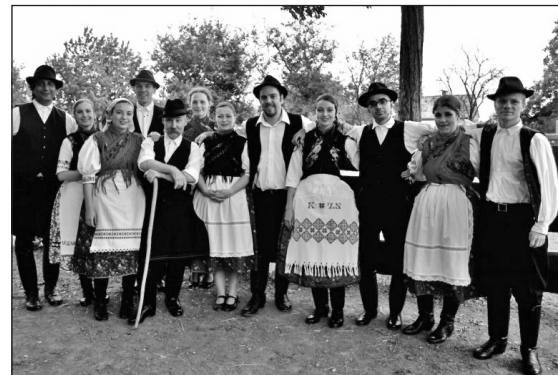
Kanada egyik legnívósabb néptáncsoportja

A gyereksoprot javarészt erdélyi származású, így nem véletlen, hogy a gyerekek felsíki játékokat és táncokat mutattak be. Az ificsoprot viszonylag új, hiszen csupán két éve létezik – a 12 kanadai magyar táncsoport közül alig három-négynek van ificsoprotja, mert a hagyomány átadása általában a tizenéveseknél szakad meg. Az ifik a Szeged kör-