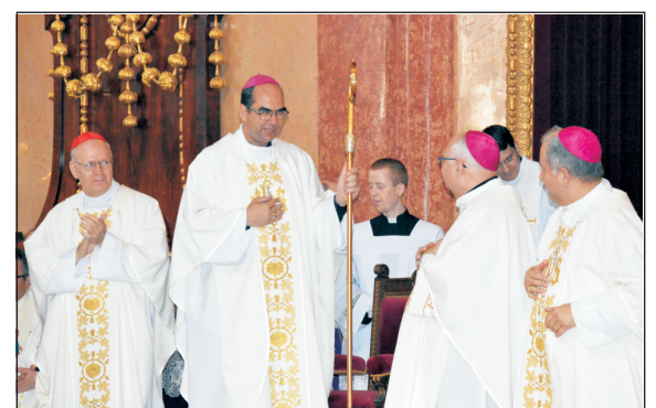
A beiktatott szombathelyi megyéspüspök