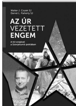
A kötet borítója