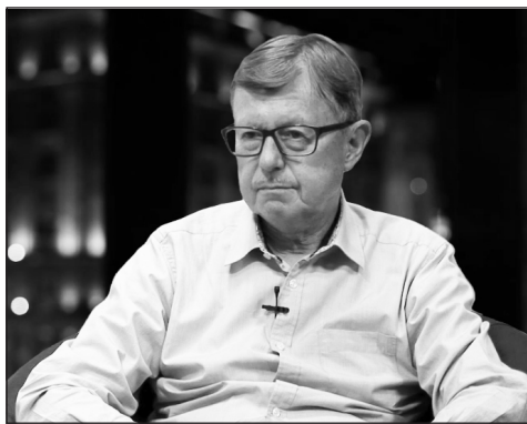
Évtizedek óta az Életünk szerzője

– Hol jártál egyetemre, és milyen szakon diplomáztál?