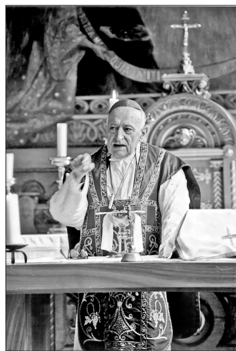
Szentmise a bécsi Pázmáneumban

Nem szabad azonban elnyújtanom ezt az utolsó fejezetet, amelyben néhány más, fontos eseményt kell még közölnöm. Ezért csak az angliai utat ismertetem igen röviden. Angliában júliusban látogattam meg a magyarokat. London-