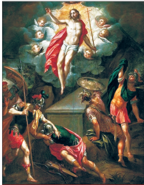
Krisztus feltámadása Hans Rottenhammer festménye