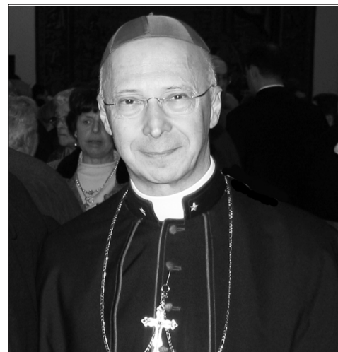
Angelo Bagnasco bíboros

Az ősi demokráciák alapja figyelembe vette a végső, meghatározott, egyetemes és tartós igazságot. Nem a véleményeket, hanem az alapvető igazságot. Ma az Európai Unióban nem létezik ez a fajta aggodalom, hogy az emberi élet mély értelmét keresse – nyomatékosította a genovai bíboros érsek. A populizmus és az Isten hiánya az egységes Európa veszélyeit jelentik. Két mélyen egymáshoz kötődő tényezőről és két veszélyforrásról van szó. Ha Isten valójában vonatkozási pont len-