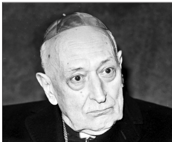
Mindszenty bíboros 1974-ben

Nélkülözvén a segédpüspököket, magam indultam el lelkipásztori utakra: helyről helyre magyar híveim közé. Előbb Európában kerestem fel őket, később azonban jártam Kanadában, az Egyesült Államokban, sőt Dél-Afrikában is. Utaimon természetesen mindig felveszem a kapcsolatot az illetékes főpásztorokkal, hogy megtárgyalhassam velük a magyar hívek és lelkipásztorai problémáit. Első utam 1972. május 20-án Németországba vezetett. Münchenben Döpfner bíboros társam vendége voltam, akinek kifejeztem a magyar nép nevében hálámat azért a nagyszabású és nagylelkű támogatásért, amelyben a német katolicizmus a rászorult magyarokat – otthoniakat és emigránsokat – a háború utáni évektől kezdve részesítette és részesíti. Május 21-én, pünkösdvasárnap a magyar emlékekben oly gazdag Bambergben a németországi magyarok Szent István millenniumi ünnepségein vettem részt. 3500 magyar zarándok volt jelen ezen az első külföldi magyar seregszemlén, s őket arra kértem, hogy őrizzék meg idegenben is a magyarság keresztény erkölcsi és kulturális hagyományait. Bíraltam az otthoni abortusz-törvényt, rámutatva annak szomorú és tragikus következményeire. A cserkészgyűlésre vigasszal és reménységgel töltött el; örömmel vettem részt a délutáni Szent István Akadémia