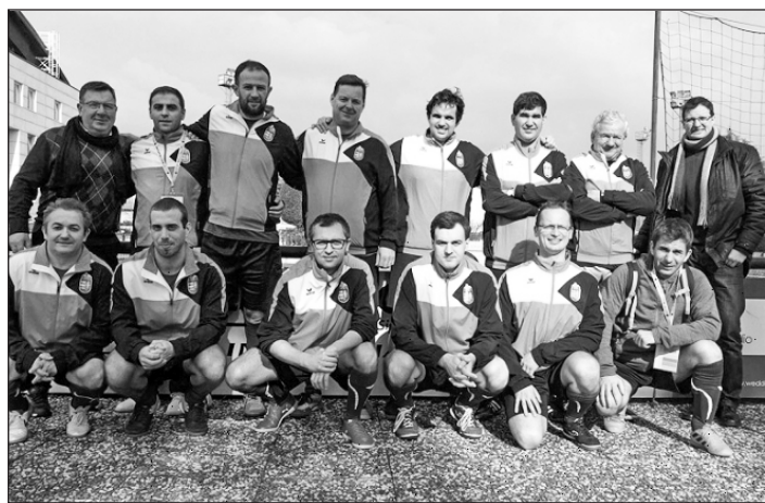
A magyar csapat

Negyedikként zárta február 8-án az olaszországi Bresciában rendezett papi futsal-Eb-t a magyar válogatott. A csapat a bronzmérkőzésen szenvedett 3–2-es vereséget a szlovákoktól.