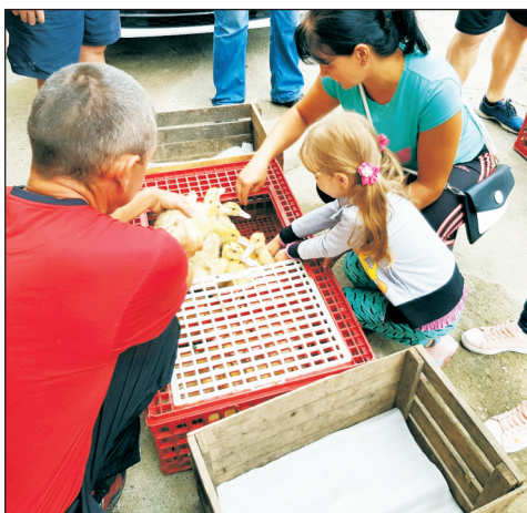
Kacsát, csirkét, nyulat kaptak a családok

A Kárpátaljai Magyar Nagycsaládosok Egyesületével közösen szervezett „önellátó nagycsalád” program keretében kacsát, csirkét, nyulat ajándékozott június végén a Máltai Szeretetszolgálat hetven családnak. Július 29-én Beregárdon osztották szét a kisállatokat a két szervezet munkatársai a háztájival is foglalkozó családoknak. A legtöbben csirkét igényeltek, de volt, aki kacsát és nyulat kért. A jószágok felneveléséhez takarmányt is adományozott a karitatív szervezet.