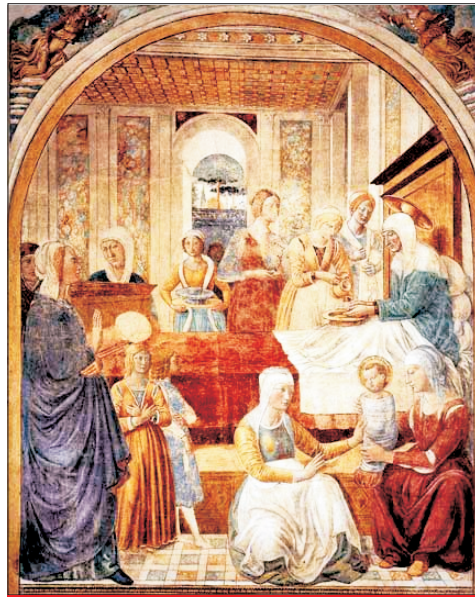
Szűz Mária születése (Benozzo Gozzoli festménye)

Kisboldogasszony napján, szeptember 8-án Egyházunk Szűz Mária születésnapját ünnepli.