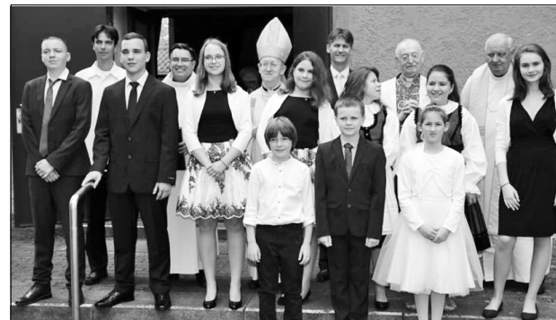
Márfi Gyula érsek bérmált Frankfurtban