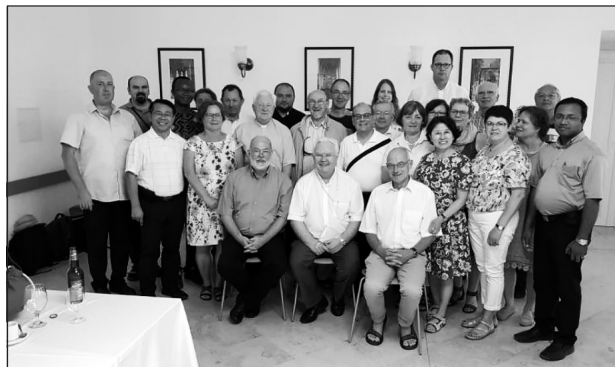
Őrzik anyanyelvi, nemzeti, hitbéli identitásukat