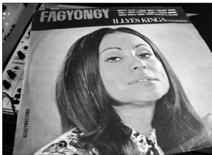
A Fagyöngy című régi bakelitlemez