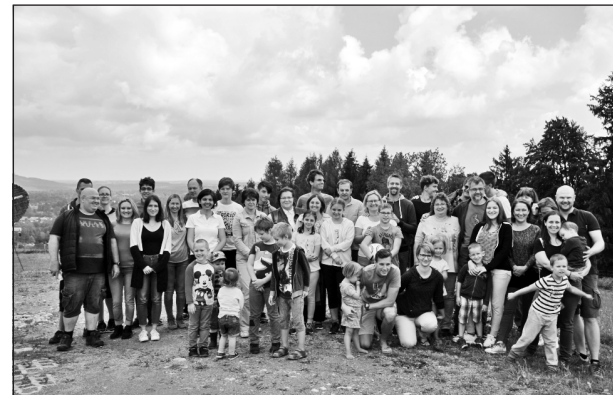
Lelki beszélgetés és túrázás is volt a programban

A szombati reggeli után szentmise következett, a misén gyermekeink olvasták föl a könyörgéseket és volt ministránsunk is. A lelki programot a mise utáni lelki eszmecsere zárta. Rövid kupakutánacs után megállapodtunk a kirándulás útitervében s elindultunk a Spitzingsee felé. Pár perc közös gyaloglás után kettévált a csoport, az edzettebbek egy hosszabb túrára vállalkoztak, a többiek a babakocsival is járható utat választották. Mindkét csapatnak volt kalandja bőven. Néhányan felmásztak egy nem is létező barlanghoz, a másik társaság pedig még a térdépről is lement. A túra végén alig