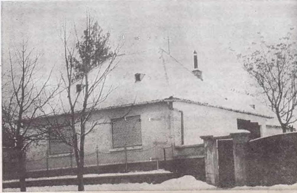
Mindszenty prímás szülőháza a vasmezei Mindszentben

A háború végén elindul egylovas kocsin, hogy vigasztalást vigyen a letört népeknek. A legtöbbet szenvedett vidékeken hozzáfog az újjáépítéshez. A körülmények azonban nem kedvezőek; megjelentek a színen az ateista hódítók nyomában a magyar moszkovíták. Egyházellenes rendszabályokat adnak ki, de az egyháziak félrevezetésével is kísérleteznek. Már tettek is elég sok kárt, amikor 1945 szept. 16-án XII. Pius pápa Mindszenty József veszprémi püspököt állítja a magyar katolicizmus élére.