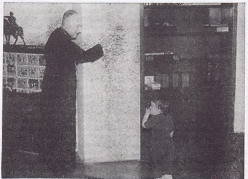
Egy kép a követségről: Mindszenty bíboros egy amerikai kisgyermekkel

Érseki székfoglaló beszédében mondta 1945 október 7-én: «Történelmünk legnagyobb erkölcsi, közjogi, gazdasági örvényében fuldoklik a vérző Magyarország. Zsoltárunk a De profundis , mámságunk a Miserere , prófétánk a siralmazó Jeremiás , világunk az Apokalipszis . Babilon vizeinél ülünk és elpattogott hárfahúrokon idegen énekekre akarnak tanítani minket... Akarok jó pásztor lenni,