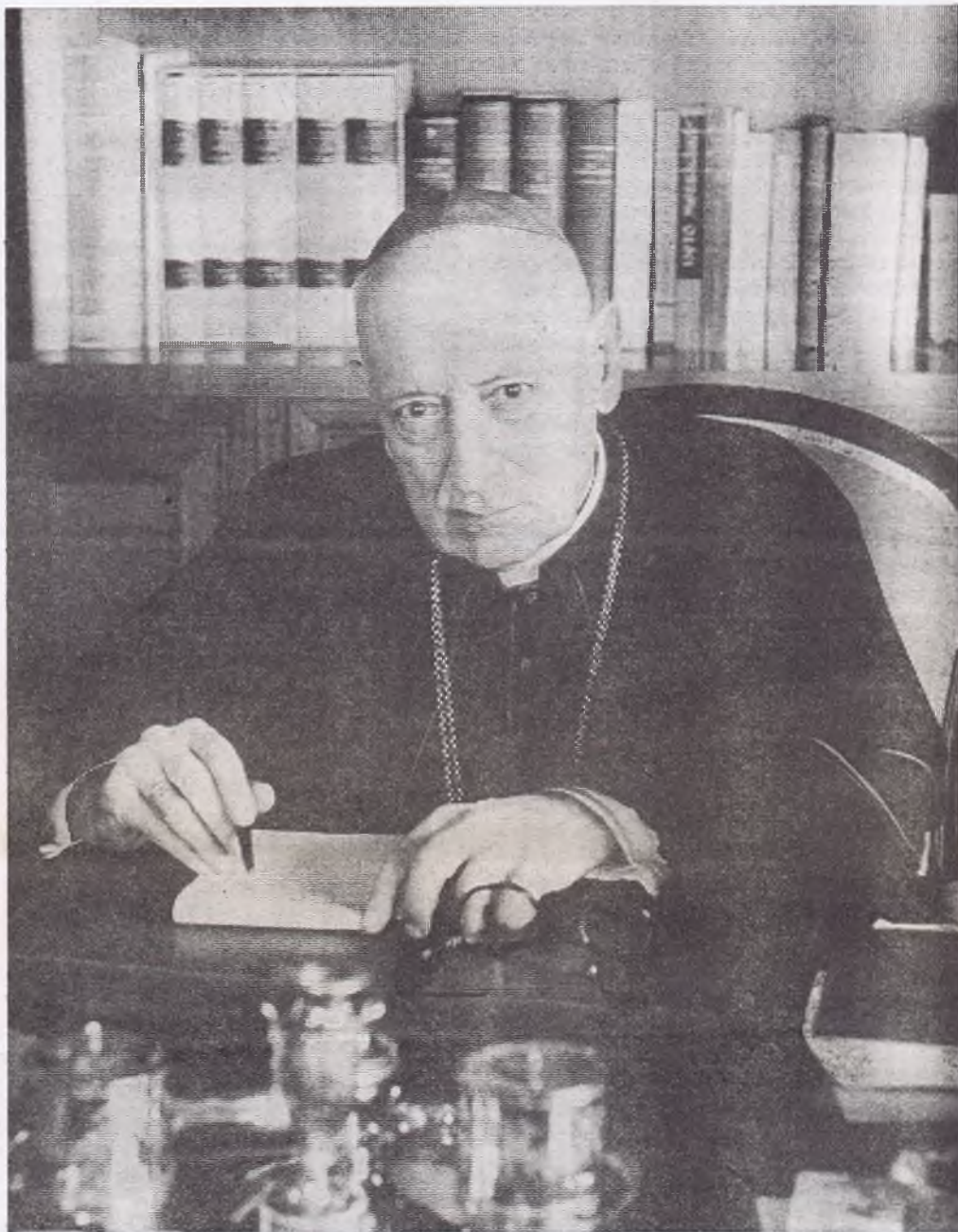
Mindszenty bíboros íróasztalánál munka közben

Mindig újra megrendülünk, valahányszor e szöveget olvassuk és ha nem az apostol írta