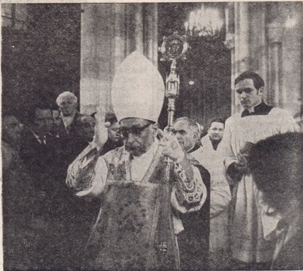
Mindszenty bíboros áldástosztva vonul a Stephansdom főoltárához

Beszéde további részében hangoztatta, hogy az emigráns magyarság tudja és ismeri feladatát s azt teljesíteni akarja a «nagy kereszt-hordozó» főpap példamutatása alapján.