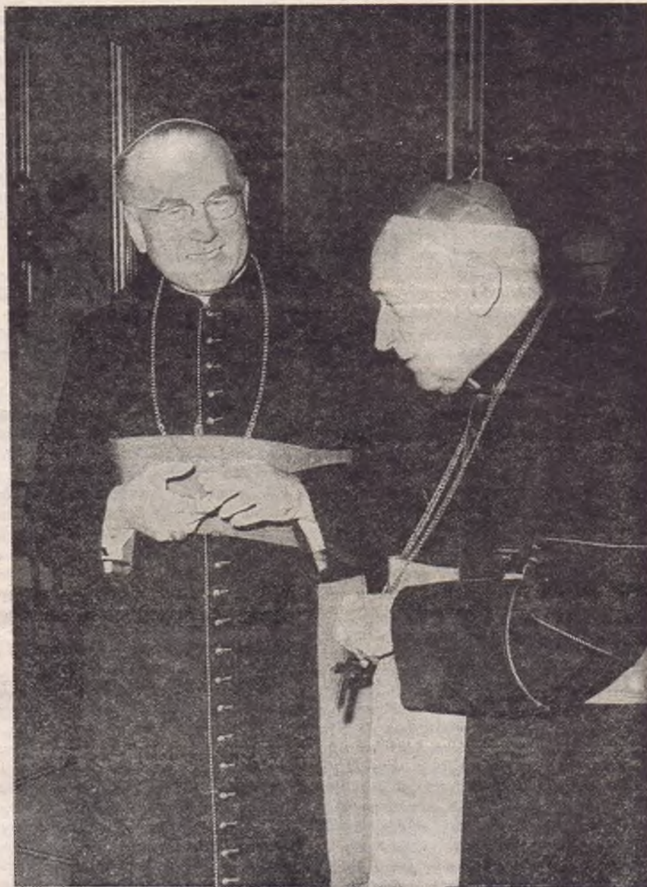
König bíboros személyesen kereste fel a magyar prímást március 29-én

A keresztség jegyében a nyolcadik napon letették a fehér ruhát, mert nem a ruha te-