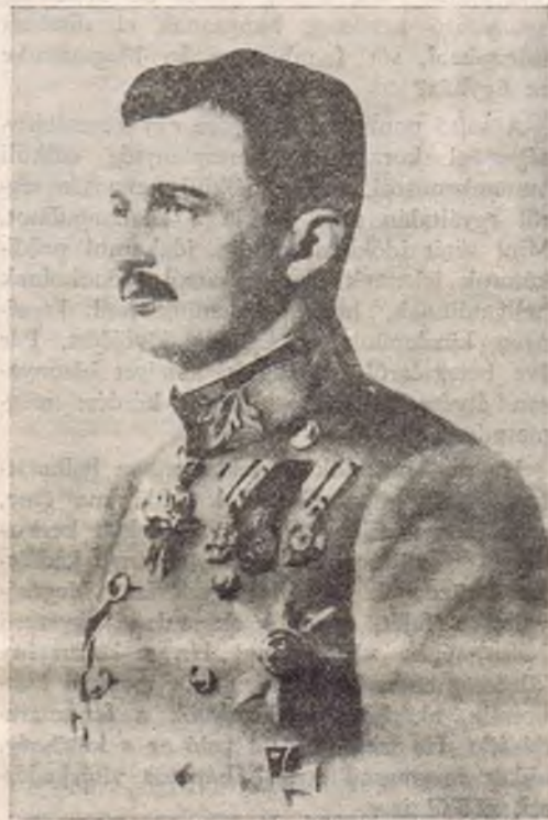
IV. Károly magyar király (1916-1922)