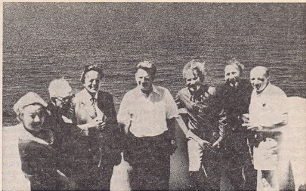
Mindszenty bíboros a délafrikai hívek egy csoportjával

— A prédikációt magyar nyelven a Primás mondta, amit azután valamelyik püspök, vagy az akit megbízott a püspök, lefordította mindjárt ott a szentmisén angol nyelvre. Utána pedig következett a Primás életének és munkájának méltatása, a nagyközönség előtt, angol nyelven. Ezeknek a beszédeknek mindig óriási hatásuk volt. Bár az emberek ismerték Mindszenty bíborost, a név az fogalom, de részleteiben az ő életét, az ő küzdelmét talán ott délen nem ismerték annyira, mint itt Európában és éppen azért volt óriási hatással ez az angol nyelvű beszéd.