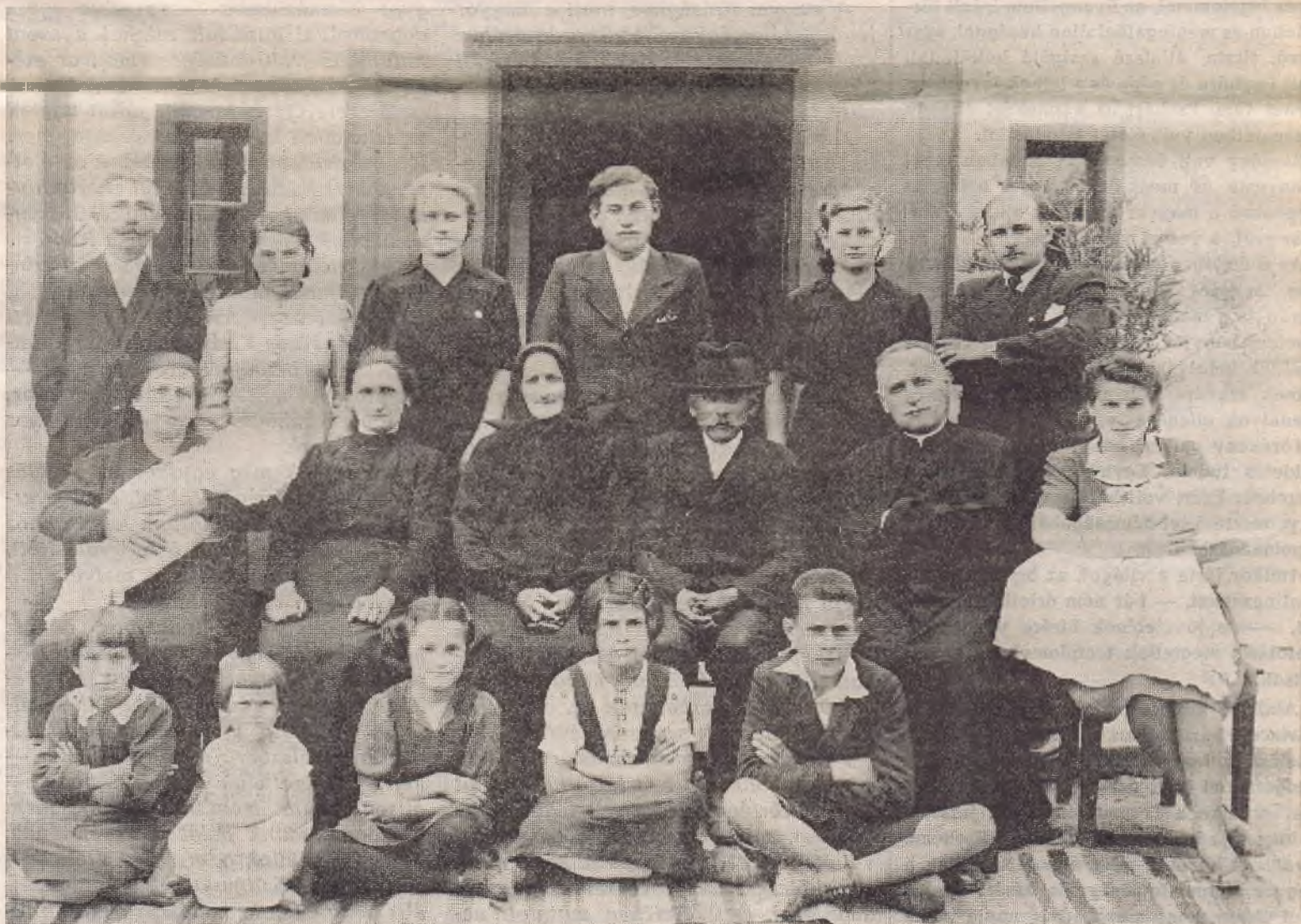
A Mindszenty-család a szülők aranylakodalmán 1941-ben.

Mindszenty, a tanú, életútja egyenes, egyszerű, világos. De bonyolult korunk