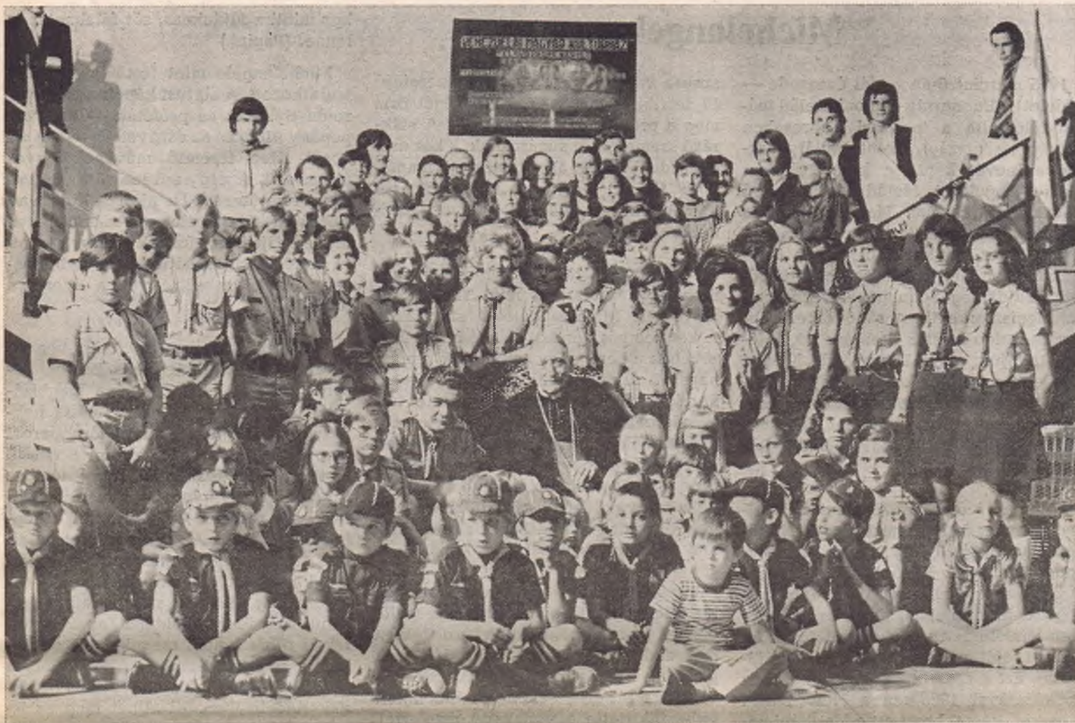
Mindszenty József híboros magyar cserkészfiúk és leányok között. A felvétel utolsó lelkipásztori útján készült Caracas-ban

bonyolult embere nehezen tud már az egyszerű dolgokban eligazodni. Mindszentyt ezért nemcsak ellenfelei, de tisztelői is sokszor félreértették. Egyesek rebellisnek mondták, holott pillanatra sem lázadt az egyházi tekintély ellen, bár mint szabad ember félelem nélkül elmondta véleményét az egyházi hatóság világi, politikai döntéseiről.