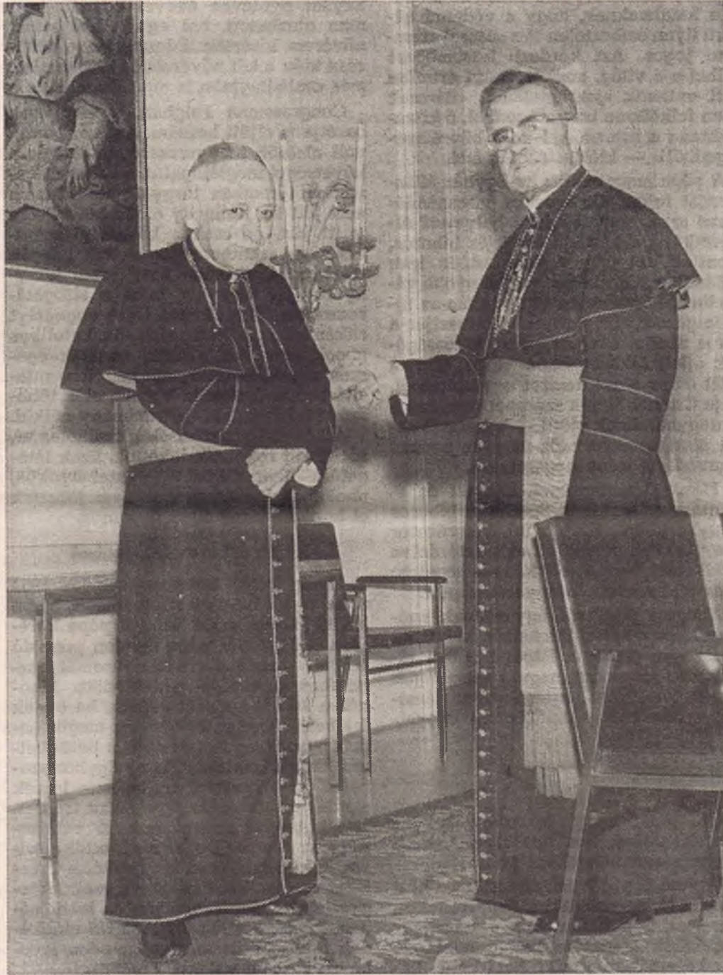
Mindszenty József magyar bíboros-prímást németországi útjának első állomásán, Münchenben Döpfner kardinális meleg barátsággal fogadta, 1972 május 19-én

1913-ban született Hessen-tartomány Bad Kissingen nevű helységében, ahol szüleinek jelentős gazdasága volt. A gimnáziumot Würzburgban végezte s itt